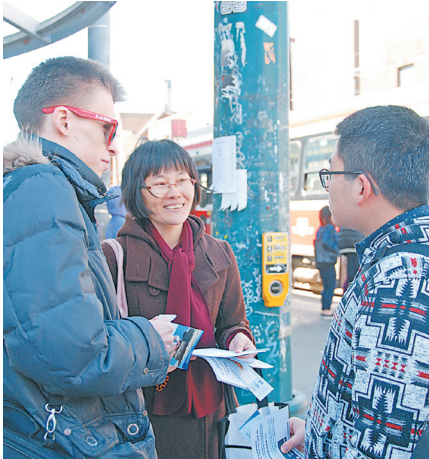
▲法轮功学员劝三退示意图。

为什么三退还要网上登记？因唯有采取公开的形式、有行为的表示才能除掉这么大的毒誓，才能在天灭中共的时候保平安。同样，你只有通过公开方式三退，表明心意，神佛才能解救你。◇