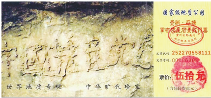
▲图为贵州平塘县掌布谷国家地质风景公园门票。

中共不等于中国，希望更多的中国人能够从中看清形势，明白真相，抓紧时机自救，顺应天意，退出邪党，选择美好的未来！◇