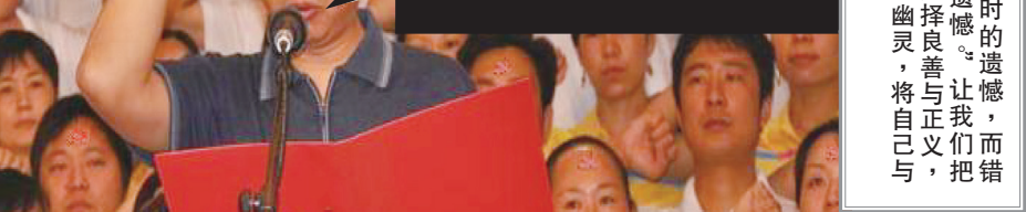
▲入中共党团队要举拳过肩发誓，说的是要随时为党牺牲性命，而且永远不背叛中共。这个誓言一出，就是一件极其可怕的事情。