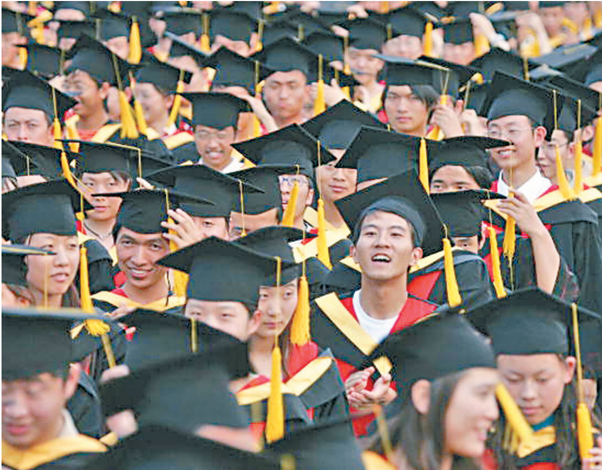
▲中国大学毕业生创业成功率低於 5%。