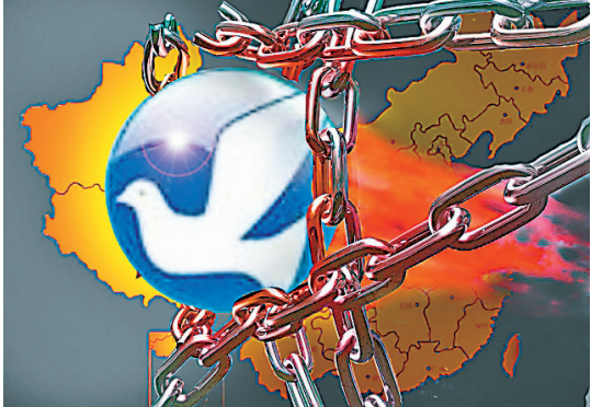
▲中共自 7 月加强网路封锁，使 VPN 无法使用，不少民众从海外带 VPN 回中国。

中国大陆十一长假於 8 日结束，数百万民众趁机出国旅游。受中国虚拟专用网（VPN）被强制下架影响，今年国人海外扫货项目多了一个“VPN”伴手礼。与此同时，VPN 被封杀之后，通过自由门翻墙流量明显增加。