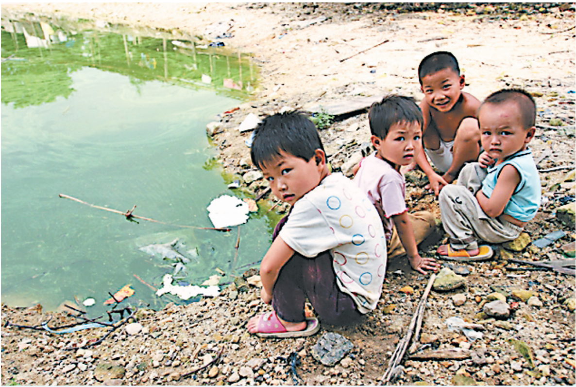
▲目前中国农村地区的留守儿童数量已超过了 2,300 多万。

报告认为，这些单独居住或与其他未成年人同住的儿童，他们的安全、健康、生活和学习状况令人堪忧。◇