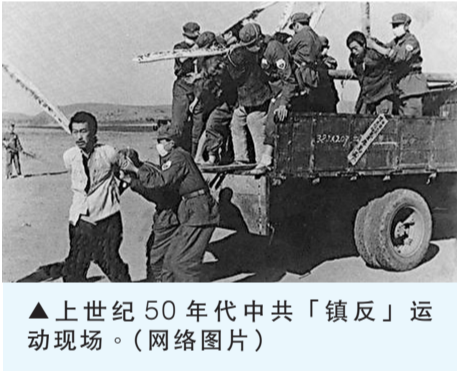
▲上世纪 50 年代中共「镇反」运动现场。

共产党的“老祖宗”马克思，早年曾经是基督徒，后来加入魔鬼撒旦教。撒旦教崇拜恶魔，与神为敌，是以破坏神的教诲、毁灭人性和人类为目的的一个邪教组织。1848年，马克思在共产党的第一份纲领文件《共产党宣言》的开篇就向世界宣布：共产主义是一个“幽灵”。这个幽灵显然就是撒旦的幽灵，是个邪灵。