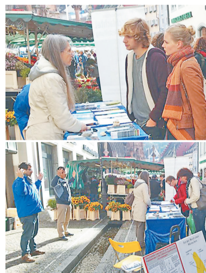
▲德国法轮功学员在著名旅游城市弗莱堡举办信息日，设立真相点，吸引各方民众驻足了解法轮功。（慧慧网）

为什么三退还要网上登记？因唯有采取公开的形式、有行为的表示才能除掉这么大的毒誓，才能在天灭中共的时候保平安。同样，你只有通过公开方式三退，表明心意，神佛才能解救你。◇