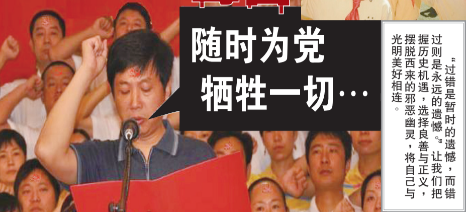
▲入中共党团队要举拳过肩发誓，说的是要随时为党牺牲性命，而且永远不背叛中共。这个誓言一出，就是一件极其可怕的事情。（网络图片）