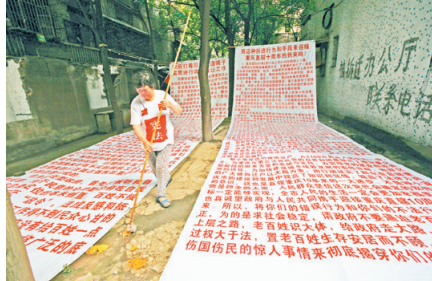
▲中共《宪法》无法保护公民合法权益。图为一拆迁户，因无法获得合法权益，身着涂写着「宪法」二字的衣服，讨要合法权益。

示，这款《宪法》是忽悠老百姓的、毫无价值的一纸空文，更是一个大笑话。“《宪法》里明明写着宗教信仰自由，但实际操作中却没有办法运用《宪法》来保护自己。只能是一些冠冕堂皇的骗人游戏。”