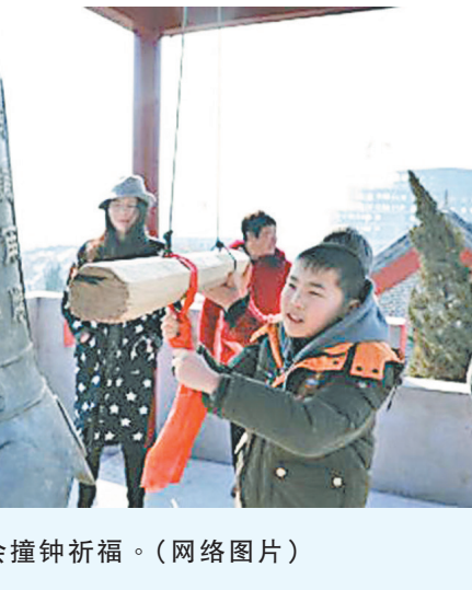
▲民众参加大陆庙会撞钟祈福。

为什么三退还要网上登记？因唯有采取公开的形式、有行为的表示才能除掉这么大的毒誓，才能在天灭中共的时候保平安。同样，你只有通过公开方式三退，表明心意，神佛才能解救你。◇