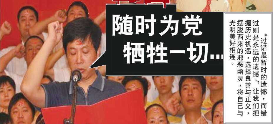
▲入中共党团队要举拳过肩发誓，说的是要随时为党牺牲性命，而且永远不背叛中共。这个誓言一出，就是一件极其可怕的事情。