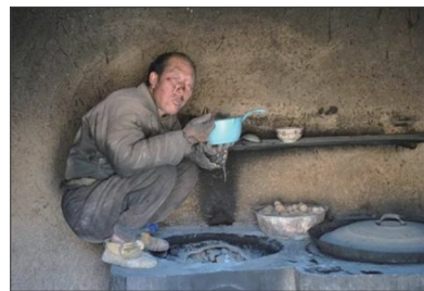
中国山区贫困人家

不过中国有近2/3的民众、特别是农村，实际收入还不到联合国最低的生活标准；据统计，中国年收入在5万人民币以下的“赤贫人口”，以及5~12万人民币的“低中层收入”，两者相加将近8亿多人口。中共国务院扶贫办公室副主任郑文凯日前也曾说，若参考每天收入1.25美元的国际贫穷线作为标准，中国贫困人口的数字将是2亿多人。