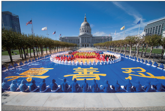
法轮功学员在旧金山市政厅前举行排字活动