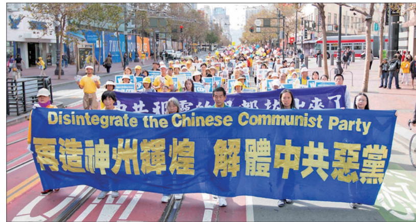
2016年10月22日四千名法轮功学员及民众在旧金山举行盛大游行

中共的出现只有90年的历史，统治中国也不过60多年。它有什么理由能说自己是中国呢？因此党和国是两个完全不同的概念，中共不等于中国。