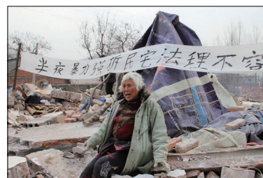
河南村支书指挥百余人深夜强拆72岁老太民房

中共一方面在《宪法》中规定，“中华人民共和国的一切权力属于人民。。而另一方面却在《党章》中规定中国共产党“是中国特色社会主义事业的领导核心”，把党凌驾于国家和人民之上。在中共集权统治下，中国人的信仰、言论、出版、集会、辩护的权利被剥夺；动用数万网警监控、封杀国际互联网。中国人的土地、房屋、财产被强占、强拆；维权人士、异议人士、甚至为法轮功学员辩护的律师遭殴打、绑架酷刑；甚至把某些团体上访都视为违法。