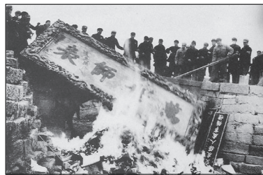
文化大革命时期，红卫兵与造反派纵火烧毁孔庙文物。

中共为了攫取、维护和巩固其政权，用邪恶的党性取代人性，用“假恶斗”的党文化替代中国的传统文化。”1966年的文化大革命中遭到破坏的庙宇、古迹、书籍等传统文物，高达90%以上。文革时“破四旧”更是一场宗教和文化的浩劫。使当今的中国人变成没有文化底蕴的无根人。文化是民族的灵魂，一个民族的文明史就是其文化发展史，当一个民族的文化根基被摧毁的时候，民族就将走向衰亡。