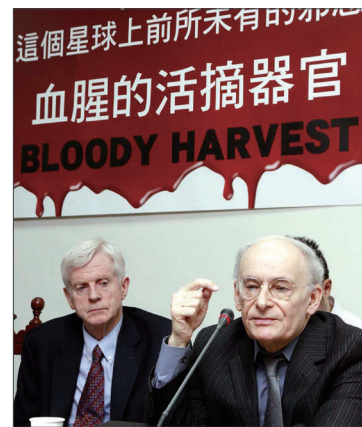
大卫·乔高(左)和大卫·麦塔斯参加在台湾立法院举行的《血腥的活摘器官》中文版新闻发布会。

计进行约150万例的器官移植手术，器官主要来源是法轮功学员。大卫·乔高表示，中国共产党、国家机关、卫生系统、医院和移植医生，都是参与摘取和贩卖器官的共犯。