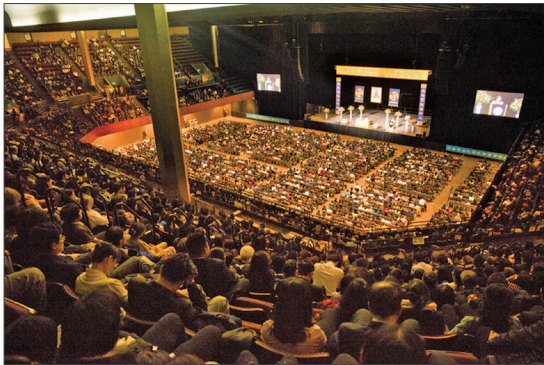
2016年10月24日近六千名法轮功学员在旧金山召开心得交流会。

广场和地标景点，举行集体炼功、反对活摘器官游行和讲真相微签。活动中有很多是来自大陆、曾受中共严重迫害的法轮功学员，他们结合自身经历，现身说法，佐证活摘器官真实发生，希望更多人参与制止这场还在中国发生的罪恶。