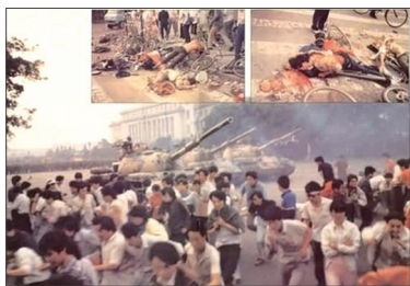
1989年6月3日晚至4日凌晨，中共军队动用坦克和机枪对付手无寸铁的学生和市民，造成上千人丧生。

中共篡政之后政治运动不断，用阶级斗争理论和暴力革命学说镇压中共之外的一切信仰，不断的消灭不同范围和群体中的异己分子，如镇反、土改、三反、五反、取缔会道门、文化大革命、六四天安门事件、迫害法轮功学员。