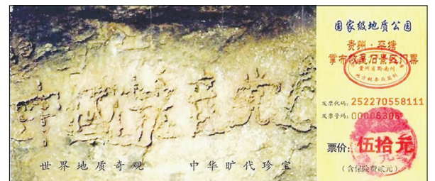
贵州藏字石风景区门票

天垂像，见吉凶，顺天而行，趋利避害。贵州“藏字石”的出现昭示了天意-党之将亡，警示世人逃脱陪葬厄运。