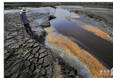
安徽省慈湖化工园区污水排放长江