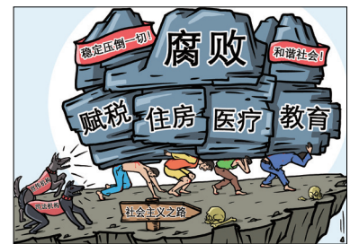
中共贪腐治国，人民苦不堪言。

中共靠腐败治国，假货泛滥，娼妓遍地，毒品复燃，官匪勾结，黑社会横行，行贿、贪污腐化等危害社会的现象泛滥猖獗，而中共却在很大程度上，听之任之、放任自流。