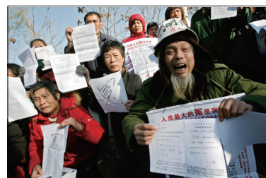
各地访民聚集北京上访