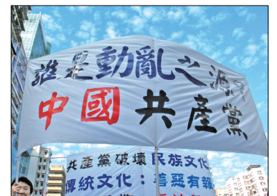
图为香港举办声援中国三退游行活动中的幅幅。

中共真正使国之不国，每个人都成为受害者。天道回圈、福祸相依、法网恢恢、疏而不漏。中共之罪罄竹难书，一桩桩都被记录在历史中。人不治天治，获罪于天，其罪无法可赦。