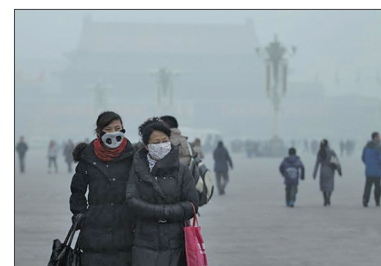
北京雾霾严重已影响人体健康