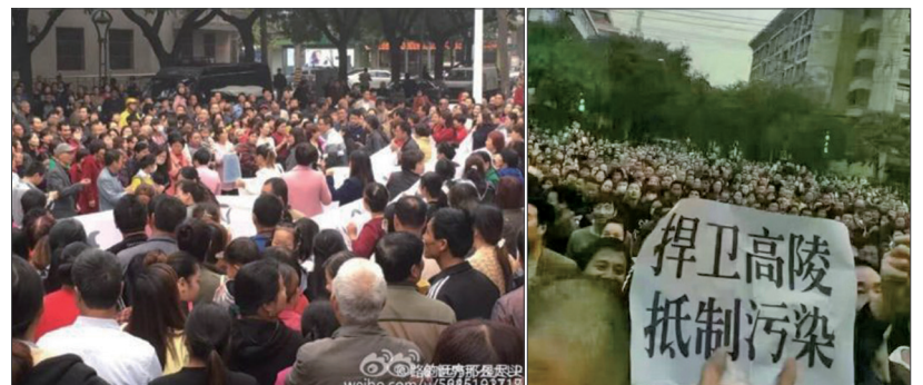
10月15日上万陕西西安市高陵区民众上街抗议建垃圾焚烧厂，警方开始大肆抓人。