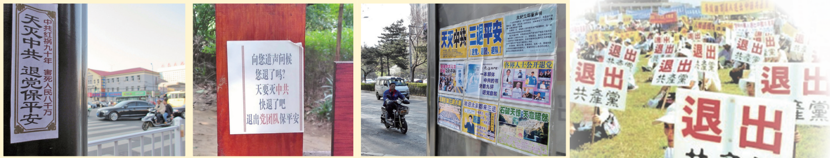
三退标语及退党声明遍布中国公共场所：左起为吉林市街头标语、四川南充公园里传单、长春市真相展板。