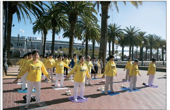
法轮功学员在旧金山市区的公园、广场和地标景点，举行集体炼功、讲真相微签。