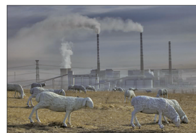
风吹草低见牛羊那已是传说!! 内蒙古草原濒临消失，当地政府放牛羊雕塑充场面。

世界上污染最严重的十个城市有七个在中国，全国五百个城市中，空气质量达到世卫组织推荐标准的不足五个。113个环保重点城市空气质量仅仅23.9%达标。北京、上海等许多城市雾霾极其严重。