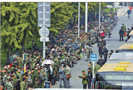
上万名退伍士官到中共军委“八一大楼”请愿，要求安置、要求生活保障。

中共当局动用超过庞大军费的预算来进行所谓的“维稳”，结果却是越维稳越不稳，不断扩张的维稳也将中国成千上万的军队和武警复员军官卷入其中，使他们成为当局动用武力镇压的维稳对象。