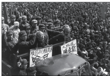
1966开始的文化大革命：专家根据中国县志记载的统计非正常死亡者至少达773万。