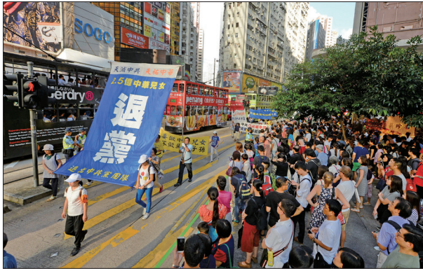
香港法轮功学员举行以“法办元凶 解体迫害 结束乱港”为主题的十一声援三退、反对迫害集会游行。

2016年10月1日超过上千名香港及来自东南亚地区及国家的法轮功学员，在香港举行反迫害及声援二亿五千万中国民众退出中共组织，壮观的游行队伍震撼许多大陆