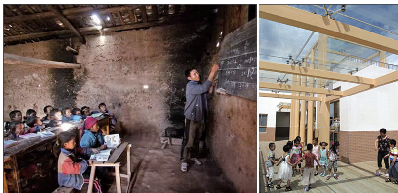
左图：四川省喜德县西河乡书口村的书口小学海拔2520米，山上和山下的孩子每天上学都要走上2小时左右，才能来到这里上学。