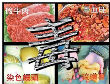
中国毒食品问题严重

目前中国物欲横流、官商勾结、贪腐盛行、坑蒙拐骗、造假频繁、环境污染、食品有毒、法官嫖妓、包二奶、比爹现象、做坏事无所顾忌、善恶不分等，均来自于失去传统道德的约束和没有正信。中共残暴地挖断了中华民族的根。