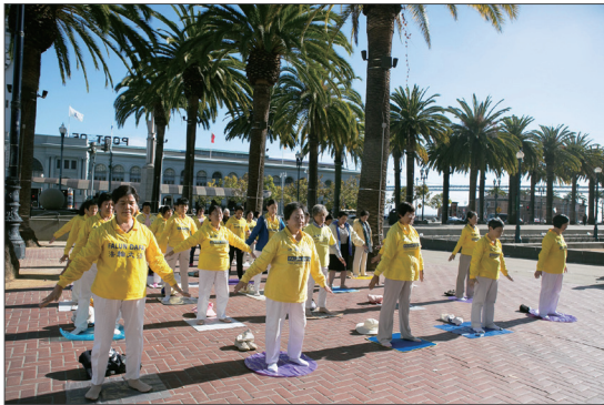
法轮功学员在旧金山市区的公园、广场和地标景点，举行集体炼功、讲真相微签。