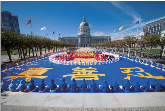
法轮功学员在旧金山市政厅前举行排字活动