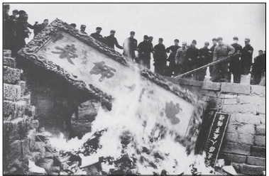
文化大革命时期，红卫兵与造反派纵火烧毁孔庙文物。

中共为了攫取、维护和巩固其政权，用邪恶的党性取代人性，用“假恶斗”的党文化替代中国的传统文化。”1966年的文化大革命中遭到破坏的庙宇、古迹、书籍等传统文物，高达90％以上。文革时“破四旧”更是一场宗教和文化的浩劫。使当今的中国人变成没有文化底蕴的无根人。文化是民族的灵魂，一个民族的文明史就是其文化发展史，当一个民族的文化根基被摧毁的时候，民族就将走向衰亡。