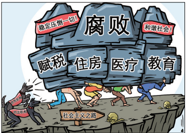
中共贪腐治国，人民苦不堪言。

中共靠腐败治国，假货泛滥，娼妓遍地，毒品复燃，官匪勾结，黑社会横行，行贿、贪污腐化等危害社会的现象泛滥猖獗，而中共却在很大程度上，听之任之、放任自流。