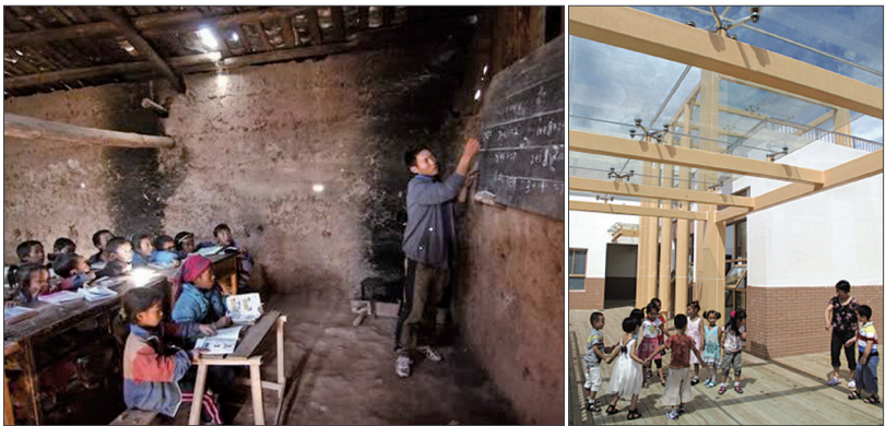
左图：四川省喜德县西河乡书口村的书口小学海拔2520米，山上和山下的孩子每天上学都要走上2小时左右，才能来到这里上学。