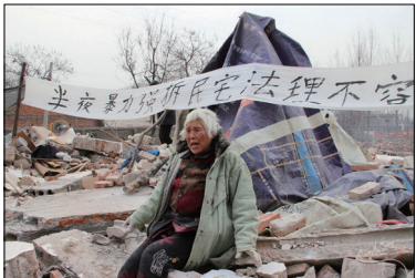
河南村支书指挥百余人深夜强拆72岁老太民房

中共一方面在《宪法》中规定，“中华人民共和国的一切权力属于人民。。而另一方面却在《党章》中规定中国共产党“是中国特色社会主义事业的领导核心”，把党凌驾于国家和人民之上。在中共集权统治下，中国人的信仰、言论、出版、集会、辩护的权利被剥夺；动用数万网警监控、封杀国际互联网。中国人的土地、房屋、财产被强占、强拆；维权人士、异议人士、甚至为法轮功学员辩护的律师遭殴打、绑架酷刑；甚至把某些团体上访都视为违法。