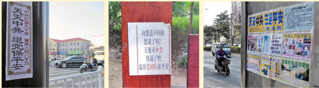
三退标语及退党声明遍布中国公共场所：左起为吉林市街头标语、四川南充公园里传单、长春市真相展板。