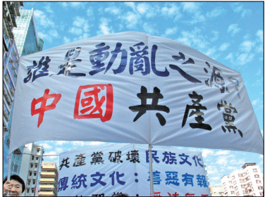
图为香港举办声援中国三退游行活动中的幅。

中共真正使国之不国，每个人都成为受害者。天道回圈、福祸相依、法网恢恢、疏而不漏。中共之罪罄竹难书，一桩桩都被记录在历史中。人不治天治，获罪于天，其罪无法可赦。