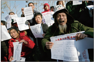
各地访民聚集北京上访