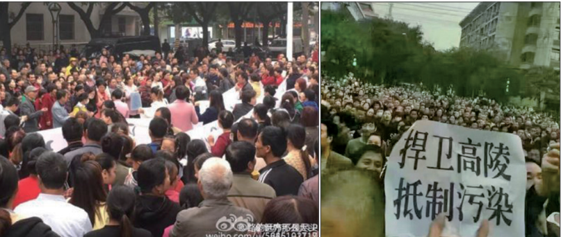
10月15日上万陕西西安市高陵区民众上街抗议建垃圾焚烧厂，警方开始大肆抓人。

欲开工的垃圾焚烧厂位于高陵城区上风口2.3公里，西安主城区上风口40公里处，周边数百米内有两所学校以及密集的居民社区。而且当地目前已经有一个电池厂与医疗垃圾焚烧站，所在地梁村已变成“癌症村”。高陵区居民担心也成为未来的“癌症村”。