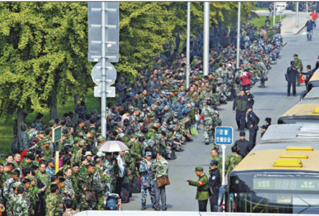
上万名退伍士官到中共军委“八一大楼”请愿，要求安置、要求生活保障。

10月11日清晨开始，来自全国各地上万名退伍士官将整个北京中共国防部大楼包围一天一夜，从木樨地至中共央视一路上站满维权军人，队伍长达二三公里。他们手举横幅，口唱军歌，要求当局合理安置，给予生活保障。这是近年最大规模的退伍军人集体维权行动。当局调动大批警力，将军人们沿路包围，同时还有大量巴士，戒备森严。