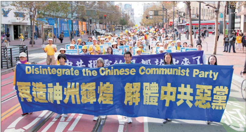
2016年10月22日四千名法轮功学员及民众在旧金山举行盛大游行

中共的出现只有90年的历史，统治中国也不过60多年。它有什么理由能说自己是中国呢？因此党 and 国是两个完全不同的概念，中共不等于中国。