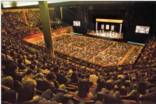
2016年10月24日近六千名法轮功学员在旧金山召开心得交流会。

广场和地标景点，举行集体炼功、反对活摘器官游行和讲真相微签。活动中有很多是来自大陆、曾受中共严重迫害的法轮功学员，他们结合自身经历，现身说法，佐证活摘器官真实发生，希望更多人参与制止这场还在中国发生的罪恶。