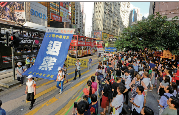
香港法轮功学员举行以“法办元凶 解体迫害 结束乱港”为主题的十一声援三退、反对迫害集会游行。

2016年10月1日超过上千名香港及来自东南亚地区及国家的法轮功学员，在香港举行反迫害及声援二亿五千万中国民众退出中共组织，壮观的游行队伍震撼许多大陆