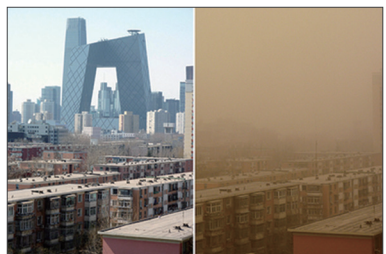
图为北京同一地点不同时间拍摄的照片，左边是晴天，右边是阴霾天气。