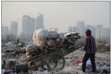
中国贫富差距已居世界之最，图为安徽合肥市林立的高楼大厦与拾荒者。

在中共内战中，中共曾承诺给农民土地，但直到今天中国农民仍没有土地所有权，房子随时面临被政府强拆的危险，每年维权的强拆案多达数万起。中共掠夺的本性造成当今中贫富差距悬殊，中共高层权贵身家亿万的同时，平民百姓背负着沉重的生活压力，还要考虑养老、子女教育等问题。