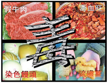
中国毒食品问题严重

目前中国物欲横流、官商勾结、贪腐盛行、坑蒙拐骗、造假频繁、环境污染、食品有毒、法官嫖妓、包二奶、比爹现象、做坏事无所顾忌、善恶不分等，均来自于失去传统道德的约束和没有正信。中共残暴地挖断了中华民族的根。