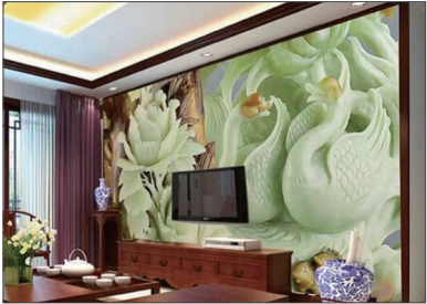
中共前军委副主席徐才厚落马后，办案人员在搜查其豪宅时，仅现金就达1顿、各种金银珠宝等用十几辆军用卡车才拉走。据称是徐家价值9000万翡翠电视墙系列组图，在微信疯传，精雕玉琢、极尽奢华。