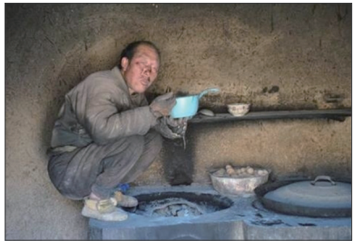
中国山区贫困人家

不过中国有近2/3的民众、特别是农村，实际收入还不到联合国最低的生活标准；据统计，中国年收入在5万人民币以下的“赤贫人口”，以及5~12万人民币的“低中层收入”，两者相加将近8亿多人口。中共国务院扶贫办公室副主任郑文凯日前也曾说，若参考每天收入1.25美元的国际贫穷线作为标准，中国贫困人口的数字将是2亿多人。