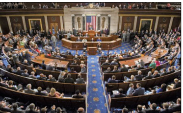
2016年6月13日，美国国会众议院一致通过343号决议案。

加拿大国会、澳洲参议院、意大利参议院人权委员会、爱尔兰议会外交事务及贸易联合委员会及美国多州州政府、市议会纷纷通过谴责中共活摘器官罪行的决议案。