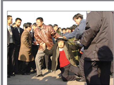
到天安门上访的法轮功学员被民警暴力抓捕