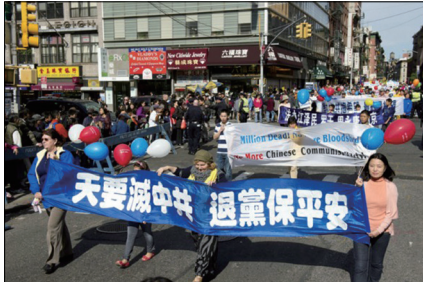
纽约声援三退游行