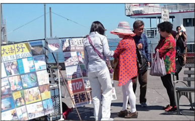
旧金山渔人码头的真相点

美国旧金山一位五十多岁的男游客站在法轮功真相展板前问法轮功学员：这上面的事都是真的吗？学员告诉他亲身受迫害的经历及“天安门自焚”