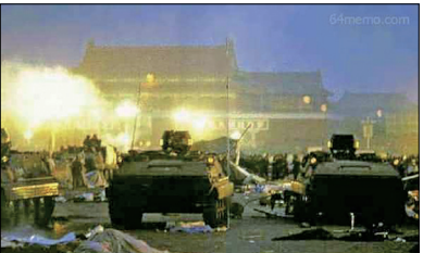
“六四事件”坦克横冲天安门广场

学生透过悼念要求民主自由。中共军队出动坦克武力镇压，造成学生及民众上千人丧生。同年12月中共国防部长迟浩田访问华府在美国防大学演说时表示：“天安门广场上没死一个人”。