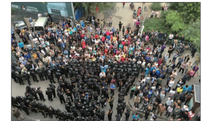
山西太原市万柏林区窰流村数千村民与数百名民警对峙，抗议当地政府对城中村改造赔偿不公。

维权与抗暴的风起云涌是民众认清中共邪党、勇于抗争作为人的基本权利，敢于和这个“政敌”说不的大规模民心觉醒，是民众对中共暴政的必然回应。