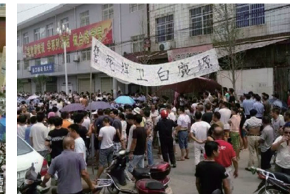
左起：湖南宁乡上万民众县府前集会抗议建垃圾焚烧厂、江苏上万民众游行反对核废处理项目、西安市白鹿原腹地蓝田县前卫镇周边上万名村民发起游行示威，抗议新建垃圾焚烧发电厂。