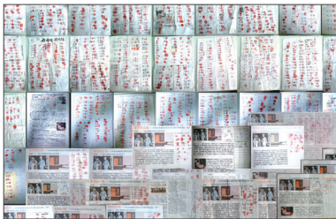
河保定、秦皇岛、张家口5038人签名反对中共活摘法轮功学员器官

活摘罪行曝光十年来，国际纷纷谴责中共的暴行。全球53个国家和地区有近150万人签名反对中共活摘器官。中国各地也兴起反活摘器官微签，据不完全统计，逾五万人签名。