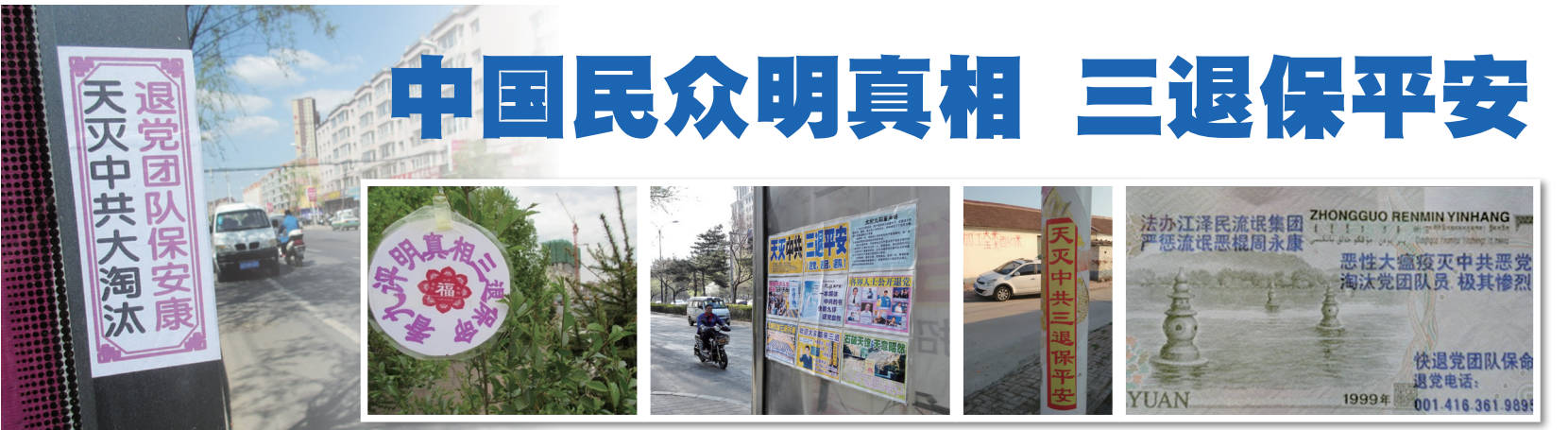
三退标语及退党声明遍布中国公共场所：左起为河北廊坊市街头标语、吉林市街头挂件、长春市真相展板、天津市街道上标语。

《九评共产党》引发中国人的三退大潮。三退标语遍布中国每个角落，许多人还自发传播《九评》劝三退。