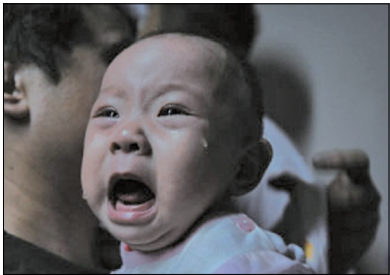
三鹿毒奶粉导致婴孩双肾结石，孩子疼得大声哭嚎。

自2008年三鹿奶粉事件后，问题奶粉没有绝迹，不断有假、毒奶粉事件被曝光，民众对国产奶制品已失去信心，纷纷抢购外国奶粉。为挽回国人