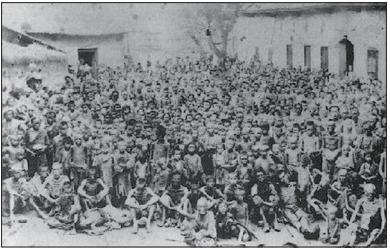
三年大饥荒，连历史上从未饿死过人的天府之国四川也饿死了八百万人。

中共建政后死亡人数最多的是“大跃进”之后的大饥荒。据《中华人民共和国历史纪实》透露死亡人数约在四千万左右。这场大饥荒被中共歪曲成“三年自然灾害”，实际上那三年风调雨顺。真正原因是1958年，毛泽东疯狂发起的大跃进，鼓励全民大炼钢铁，使农业生产全部停顿，完全是彻底的人祸。