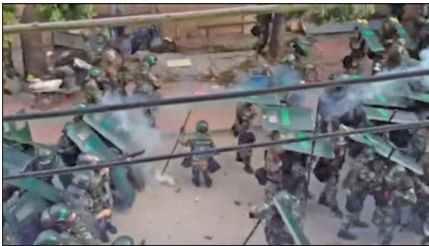
乌坎村闯进逾千防暴警察抓捕村民，警民爆发大规模流血冲突。许多中枪村民身上多处出现弹孔，鲜血直流。