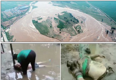
邢台泄洪死伤惨重，许多村民没接到通知来不及逃亡被淹死，惨不忍睹。