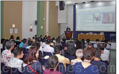
香港民间举行活摘器官研讨会

8月22日，大纪元时报在香港举行“中国大陆活摘器官问题研讨会”，包括美国政府观察机构、欧美政要代表、人权律师、国际器官移植与医学伦理专家和国际调查组织的代表出席。美国资深国会议员克里斯·史密斯谴责中共试图灭绝法轮功是21世纪最严重的罪行之一，包括活摘器官。前欧盟副主席爱德华·麦克米兰·斯考特也以书面表明支持制止中共强摘罪行。