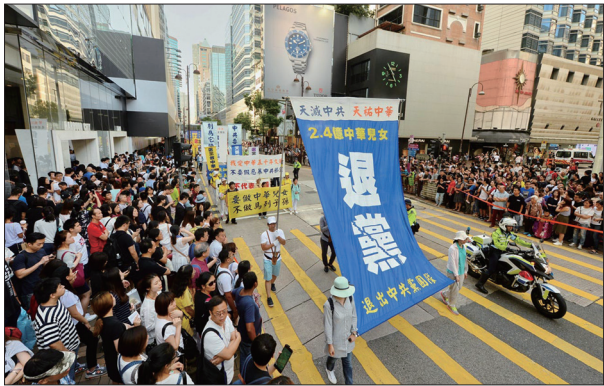
8月21日，香港法轮功学员举行反中共活摘器官大游行，同时声援逾二亿四千万人退出中共。

9月6日，中共喉舌《人民日报》刊文自曝中共党员不愿意缴党费，这种情况不仅仅发生在国企，也发生在事业单位甚至党政机关中。