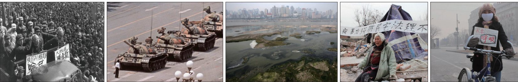
左起:文化大革命批斗游行、六四天安门事件中共坦克镇压人民、中国水污染严重、河南村支书记强拆72岁老太太的房子、北京雾霾严重影响人民健康。