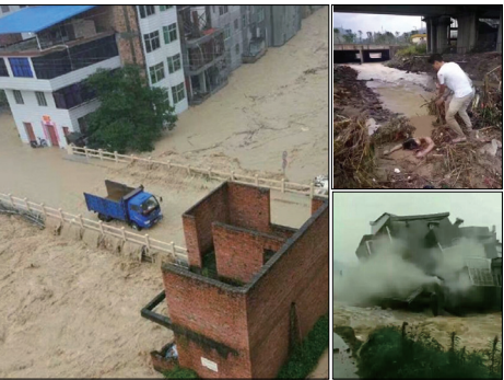
台风“尼伯特”登陆福建，闽清县阪东镇特灾情特别严重，居民伤亡惨重。