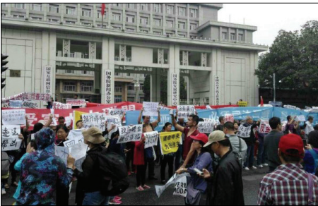
来自中国各地的泛亚投资受害在国务院新闻办公室门口伸冤