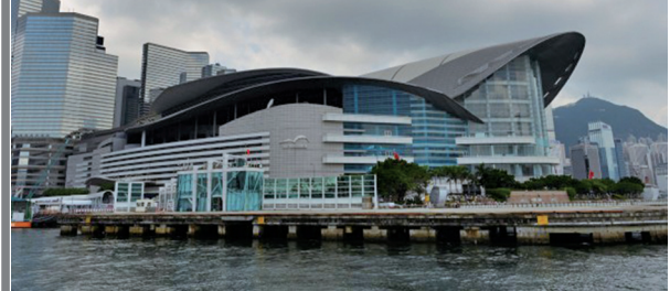
第26届国际器官移植大会在香港湾仔会展举行

2016年8月19日至23日，第26届国际器官移植大会在香港湾仔会展中心举行，会议上大陆医生借着国际学术会议高调宣称中国器官移植的成果，却被国际人权机构和医生组织揭发是参与活摘良心犯器官的杀人嫌犯，引发争议。