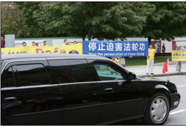
李克强访问国会山，其专车经过法轮功学员的横幅。