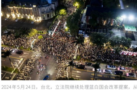
2024年5月24日，台北，立法院继续处理蓝白国会改革提案，从高处望去的青岛东路、济南路及中山南路，大量民众聚集立法院外抗议。

5月24日晚，台北立法院周边聚集了10万抗议民众，他们发起“我藐视国会”行动，反对国会扩权。前联电董事长曹兴诚在集会上表示，今天我们为什么站出来？因为中共黑手、打手已潜到国会，“中共害怕我们有自由”。