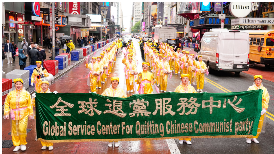
2024年5月10日，法轮功学员在曼哈顿举行大游行，庆祝世界法轮大法日。

“现在小区内除最后一道门（业主居民的家门）外，其它第一道门、第二道门，那些居委会、派出所、门卫、打扫卫生的、收水电费查表、天然气查表等人员都可随便进第二道门。有中共的安全老百姓就处处危险，走厕所它都在监控你。老百姓有冤无处申，太苦了！盼老天早灭这魔鬼。为了不做它的陪葬品，我们彻底退出中共的一切组织。”