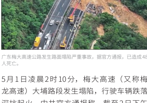
广东梅大高速公路发生路面塌陷严重事故，据官方通报，已造成48人死亡。

5月1日凌晨2时10分，梅大高速（又称梅龙高速）大埔路段发生塌陷，行驶车辆跌落深坑起火。中共官方通报称，截至2日下午2时，造成23辆车掉落，造成48人死亡，另有3人的DNA比对确认，30人受伤。