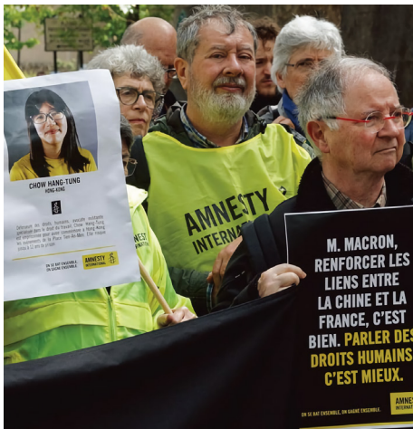
5月4日，国际特赦组织抗议中共暴政。