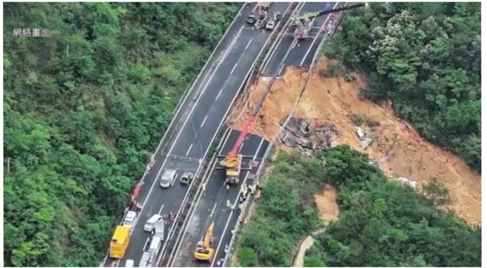
广东梅大高速公路发生路面塌陷严重事故，据官方通报，已造成48人死亡。

务区上厕所。就因为这样耽搁了几分钟，救了他们一命。这位躲过一劫的朋友回忆说，遇难的一家五口，在事发前，还曾经帮他们买好了鼓浪屿的门票。