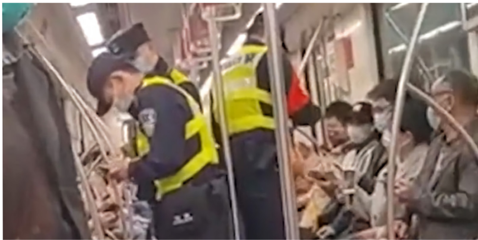
图为三名中共公安在地铁车厢挨个翻查乘客的手机。(网络视频截图)

官员可能随时以“紧急情况”为借口，下令国安警察检查个人手机和电脑等电子设备，而无需任何法律手续。《规定》第四十二条还规定，国安部门还可以查验电子设备使用或存放的场所等。