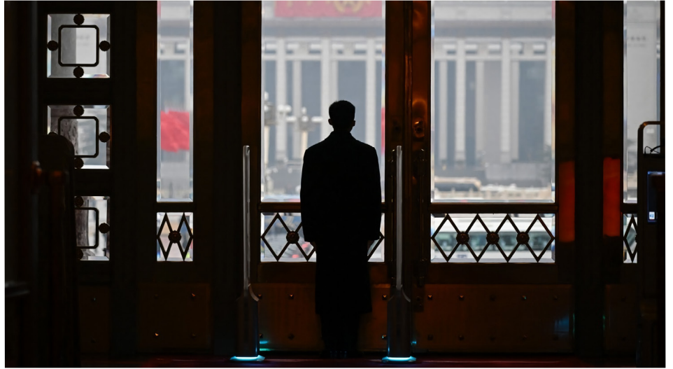
美媒披露，美国情报机构正在撰写一份涉及中共高层腐败和隐匿财富的报告。