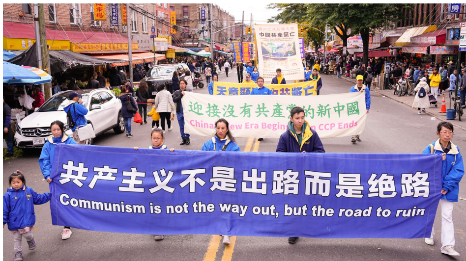
2023年10月15日，法轮功学员在布鲁克林举行大游行，声援中国民众三退。