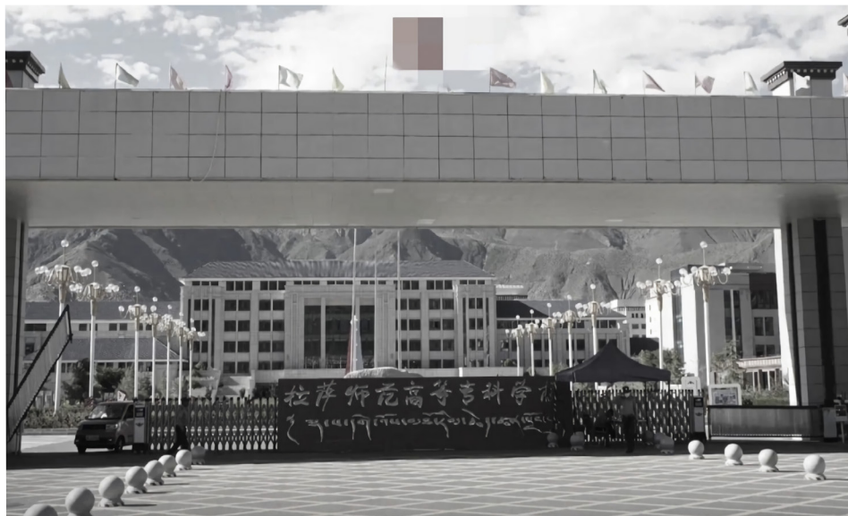
今年3月，西藏拉萨师专20多名学生遭中共镇压死亡。图为拉萨师专校门。

坐地起价，价格就是极其不合理，就是一杯豆浆要你7块钱，然后就是一个特别普通包子卖你15块。”