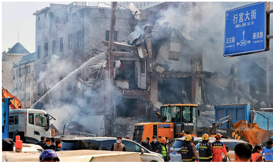
与北京相邻的河北三河燕郊镇迎宾路一栋楼房3月13日上午突然爆炸。