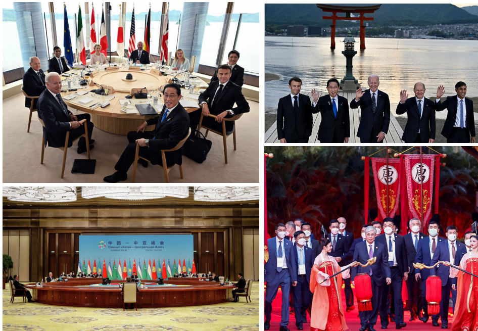
左上：G7峰会上直径不到3米的会议桌；左下：中亚峰会的超大型圆桌；右上：G7领导人在日本的合影；右下：中共欢迎中亚5国领导人的奢华仪式。

5月19日到21日，包括美国、法国、德国、英国、加拿大、意大利和欧盟在内的主要发达国家领导人，在日本广岛举行G7峰会，而在此前一天，由中共主导的中国-中亚峰会在西安举行。