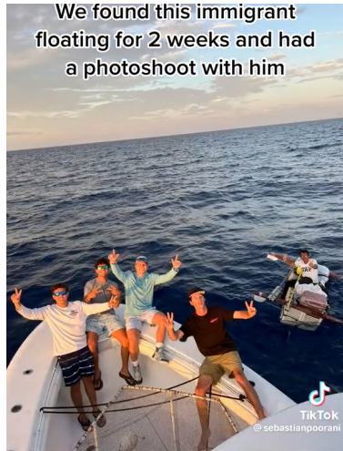
TikTok一个视频中显示，一位貌似中国人自制木筏走线美国，一人在海上漂流两周后，在迈阿密海域得到几个在游艇上游玩的美国青年的帮助。

近日，一则意大利签证暂停办理的消息在微博上发酵，中国大陆多家旅行社传出意大利使馆暂停团体旅游签证的消息。