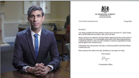
英国首相办公室发信赞扬法轮功学员坚守信仰、和平传播真相二十四年。左图为英国现任首相里希·苏纳克。

多位美国国会议员声援法轮功学员，他们表示将持续采取行动，制止中共迫害。今年二月史密斯议员提出《2023年停止活摘器官法案》惩罚活摘器官罪行。美国国会众议员古斯·比利拉斯基说：“残酷的共产主义政权的暴力镇压和对信仰者的持续迫害侵犯了所有人权中最基本的一项权利——自由行使信仰的权利。我们有义务代表那些被噤声太久的人们大声疾呼。”