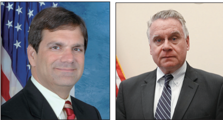
美国国会众议员古斯·比利拉斯基(左)和史密斯议员声援法轮功学员反迫害