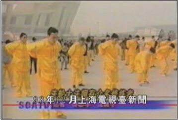
1998年11月24日上海电视台播放近万名法轮功学员在上海体育中心集体炼功的采访。

从1992年5月至1999年7月的七年间，据中国公安部内部调查，大陆炼法轮功的人数达到七千万至一亿，大陆媒体也做过不少正面报道。1998年5月15日中央电视台在《晚间新闻》和第五套节目中分别报道国家体育总局伍绍祖局长视察长春，广大群众修炼法轮功的盛况。1998年11月24日上海电视台报道法轮功已传遍欧美澳亚四大洲，在上海及世界其他国家广受欢迎的情况，称全世界已有一亿人在炼法轮功。1998年11月香港电视《城市追击》节目播放广州天河万众齐炼法轮功的活动，以及广东各地举办的数千上万人法轮大法修炼心得交流会。