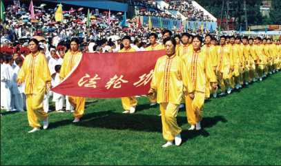
1998年8月法轮功学员参加沈阳市举办的亚洲体育节。《中国青年报》8月28日刊载《生命的节日》进行报道。