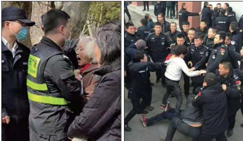
左图：上海90岁访民被十余名员警包围掐颈抢走诉求状。右图：山西省吕梁市临县60名农民工到县政府讨薪遭员警镇压。

在425树立和平理性制止迫害的典范下，在随后的二十多年中国和海外的法轮功学员们始终走在一条慈悲善良、和平理性，展现法轮大法“真善忍”的美好的讲清真相之路。