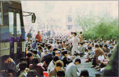
1999年4月18日至24日天津数千名法轮功学员前往教育学院及其它相关机构反映实情

1999年4月11日何祚庥在天津教育学院办的《青少年科技博览》杂志上发表题为“我不赞成青少年练气功”的文章，引用不实的事例污蔑炼法轮功会使人得精神病，并暗指法轮功会亡党亡国。何祚庥是政法委书记罗干的连襟，名为院士，却没有任何学术建树，是一个依附政治的文人。在此之前，何祚庥就曾在北京电视台的节目中用一个和法轮功没有关系的例子诋毁法轮功，北京的法轮功学员指出其错误，北京电视台也承认失误。可是此次何祚庥再次利用这个不实的事例诬陷法轮功。天津法轮功学员于4月18日至24日纷纷前往杂志社及其它相关机构反映实情期望杂志社编辑部澄清事实，消除该文章恶劣的社会影响。该杂志社拒不认错。前往交涉的人也越来越多。