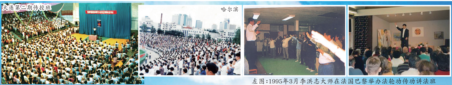
左图：1995年3月李洪志大师在法国巴黎举办法轮功传功讲法班 右图：1995年4月李洪志大师在瑞典哥德堡举办了七天的传功讲法班