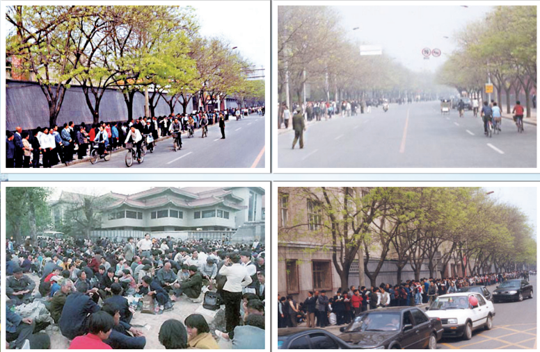
左图:1998年武汉五千名法轮功学员排出法轮图形及真善忍。右图:上万名法轮功学员到中南海附近的中央信访办和平上访，整个过程秩序良好交通井然。

四二五这个日子记载万名法轮功修炼者在最专制严苛的环境下，以至纯至真、大善大勇、理性自律的方式，彰显“真善忍”修炼理念的伟大壮举；它树立和平理性制止迫害的典范。在随后的二十二年中国和海外的法轮功学员们始终走在一条慈悲善良、和平理性，展现法轮大法“真善忍”的美好的讲清真相之路。