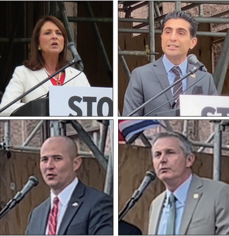
德州参议员安吉拉·帕克斯顿(左上)、众议员萨尔曼·博贾尼(右上)、众议员杰顿(左下)和众议员奥利弗森(右下)参加德州法轮功学员纪念425集会