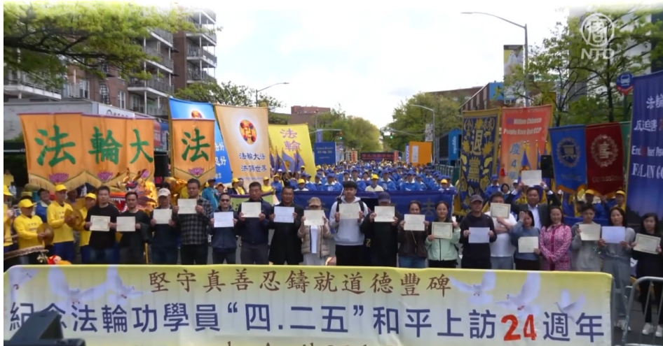
法轮功学员在纽约法拉盛举行盛大游行和集会，纪念4·25和平上访24周年。

将时光倒流24年，1999年4月25日，一个晴朗的星期天，北京发生万名法轮功学员到中南海和平上访事件。