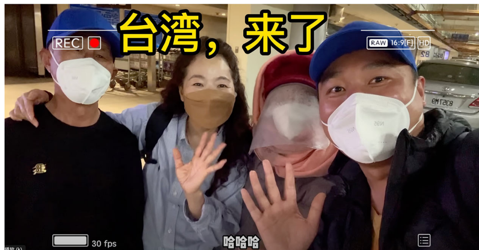
一名不愿具名的善心台湾女子（左二）抵押自己房产担保Jake母亲赴台就医，并前往接机，Jake称她是“贵人姐姐”。