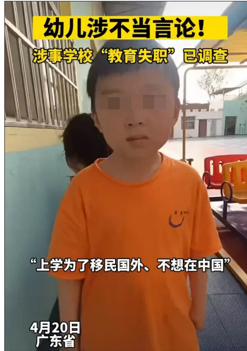
4月20日，广东五岁孩童的视频网络热传。

日前，一个关于5岁孩童的视频引起热议。从互联网上曝光的视频片段中可看到，幼儿园的一名女教师正柔声对排着队的孩子们逐个询问“你为什么来上学啊？”其中一个小男孩天真地回答说：“我为了长大不想要在中国住了，想要去英国。”