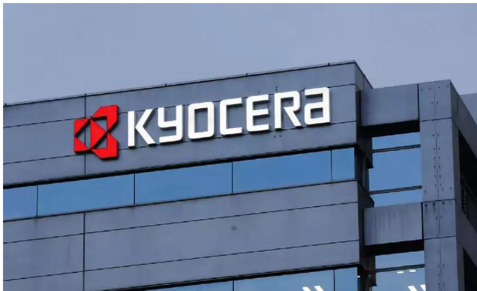
近日，京瓷关闭了位于中国天津市的太阳能面板工厂，曾赠送中国首个光伏电站。

京瓷代表全球科技巨头的一种潮流，即科技从中国外流。全球第三大计算机制造商戴尔科技透露明年停止使用中国微芯片的计划，并已告诉供应商减少使用其他中国产部件的数量。