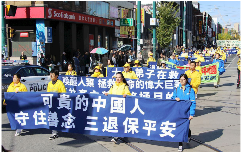
2019年10月12日，加拿大多倫多法輪功學員在市中心舉行了大遊行。

我來到海外後，雖然經常給父母打電話，但一般都是我媽媽接電話，爸爸很少接，接了也就是簡單寒暄幾句。我曾三次寫家書給爸爸，收到的回復基本都是，