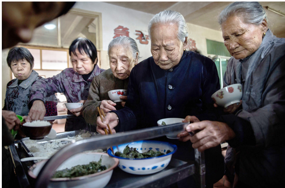
图为2016年3月17日，在福建省沙县的一家养老院，老人们为自己准备午餐。

议了。让我们攒钱，所以我每天省两顿饭来规划买房子。每个月攒出来90%的工资来规划生孩子，每个月不吃不喝不拉不撒地攒钱。