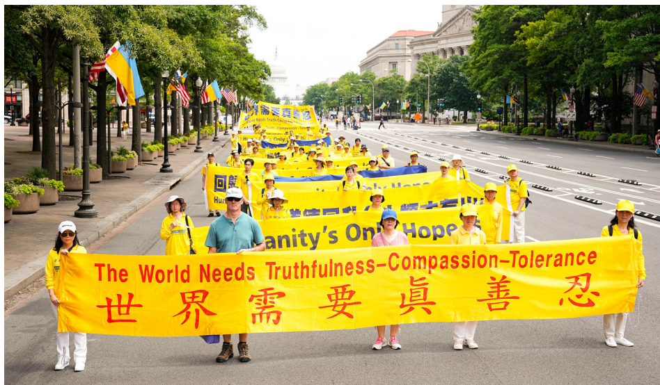
2022年7月21日，法轮功学员在美国华盛顿DC举行呼吁制止迫害的大游行。

那时候，我们家属区每家的电表都是安装在自己家里，很多人都在表上做手脚，好少出电费。我也随波逐流，控制了电表，一个月出几元钱，还觉得自己比别人好。可是，参加了师父的讲法轮功学习班以后，我几晚都睡不着觉，