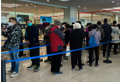
2023年1月4日，上海一殡仪馆内，许多民众排队等待办理亲人殡葬事宜。

中共疾病控制与预防中心2月4日声称，过去一周，中国医院内因染疫死亡的人数为3278人。但是大纪元记者调查，仅上海一个城市，目前每天火化的就至少2640具遗体。