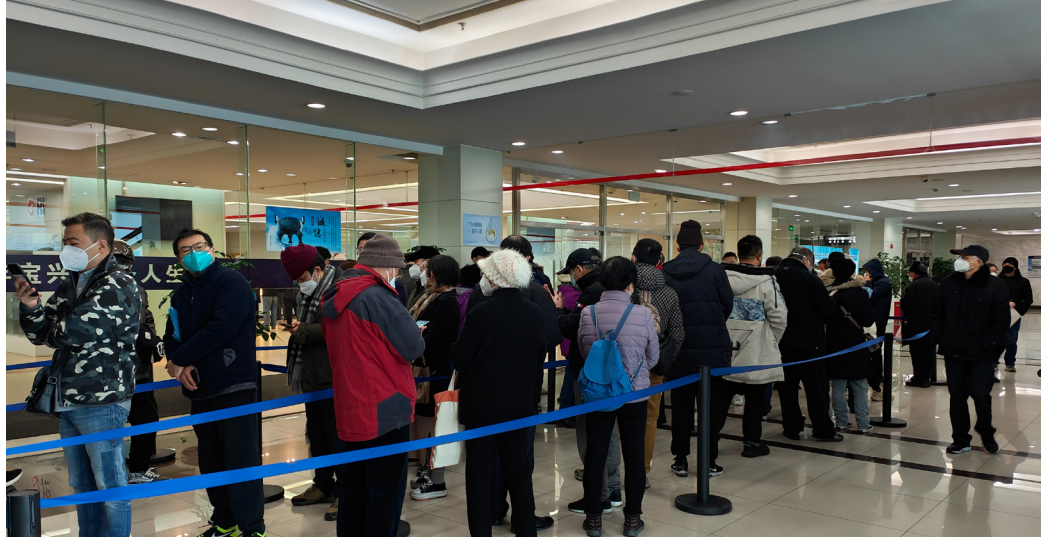
2023年1月4日，上海一殡仪馆内，许多民众排队等待办理亲人殡葬事宜。

中共疾病控制与预防中心2月4日声称，过去一周，中国医院内因染疫死亡的人数为3278人。但是大纪元记者调查，仅上海一个城市，目前每天火化的就至少2640具遗体。