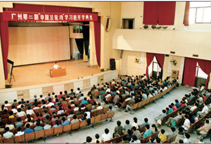
李洪志先生1993年10月在中国法轮功广州第二期传授班上讲法传功

李洪志先生荣誉证书。由于法轮功在祛病健身、提升道德方面具有神奇功效，很多人身心受益从疑难绝症中康复，口耳相传，使法轮功在中国迅速普及。