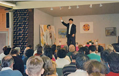
1995年4月李洪志大师在瑞典哥德堡举办了七天的传功讲法班

1995年3月13日李洪志大师受中国驻法大使馆的邀请，在巴黎中使馆文化处举行一场讲法报告会及第一场海外法轮功学习班，法轮功正式走向海外。同年4月14日李洪志大师来到瑞典哥德堡举办了第二场海外法轮功学习班。1996年10月12日在休士顿讲法，当天被休士顿市长宣布为“李洪志大师日”，并被授予“荣誉市民”和“亲善大使”的称号，法轮功开始在世界各地弘传。