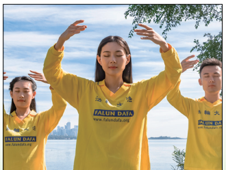
第二套功法-法轮桩法