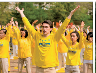
第三套功法-贯通两极法