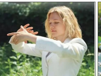
第四套功法-法轮周天法