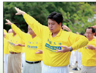
第一套功法-佛展千手法