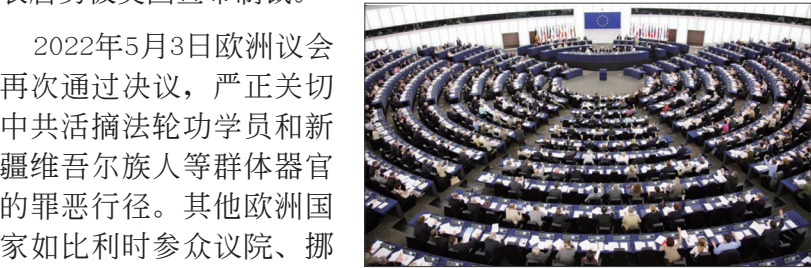
2022年5月5日欧洲议会通过紧急决议严正关注中共活摘器官。

2022年5月3日欧洲议会再次通过决议，严正关切中共活摘法轮功学员和新疆维吾尔族人等群体器官的罪恶行径。其他欧洲国家如比利时参众议院、挪威国会、意大利参议院、爱尔兰议会等都相继通过支持议案，呼吁制止迫害法轮功。澳大利亚参议院2008年6月24日通过127号动议案，要求中共停止迫害法轮功学员。台湾立法院及12个县市议会相继通过拒绝中共人权重犯入台提案。国际社会正在集结反迫害法轮功的正义浪潮。