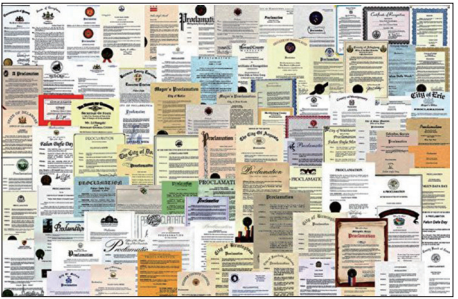
海外各界褒奖及支持信函

法轮功洪传全世界,为各地社会带来可喜的变化,因此受到各地民众和政府的欢迎,法轮大法造福人类,被称为“高德大法”。国际社会为表彰李洪志先生和法轮大法对人类身心健康所作出的杰出贡献,至今获得来自全球褒奖有3737项,支持议案547件,支持信函1444封。