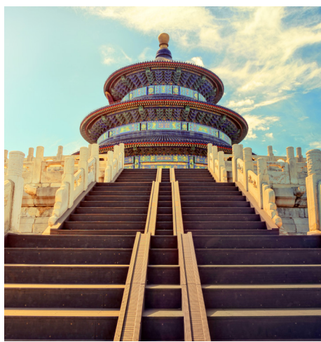
中国传统文化讲“天人合一”

古人讲的“天”是指天意、命运；古语中的“定”包含着安定、平定的含义，不是表示程度的“一