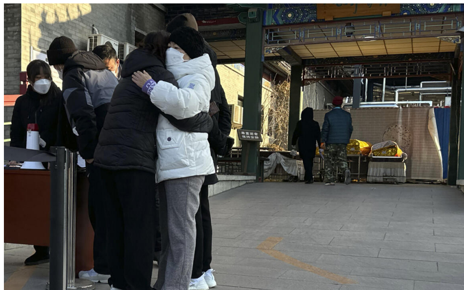
2022年12月31日，北京的一个火葬场外，送葬者相互安慰。

中共在毫无事先准备的情况下，于12月7日突然取消防疫政策。随后，全国疫情排山倒海而来，火葬场和医院系统纷纷崩溃。专家表示，中国民众恐面临自大跃进以来最大规模的死亡事件。