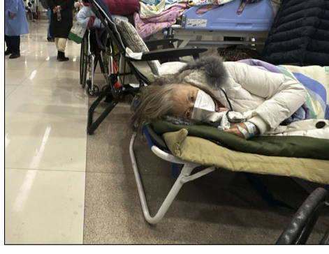
2022年12月31日，北京某医院内的场景。