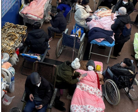
2023年1月4日,上海一家医院急诊室里的染疫病人。

中国最大城市上海在一年里经历两次劫难,在上半年经过三个月的清零封控后,如今又因中共突然放开弄得措手不及。据文汇报报道,2022年12月至今,随着染疫者持续飙升和重症高峰的出现,上海的三级医疗体系迎来史无前例的“最艰难时刻”。