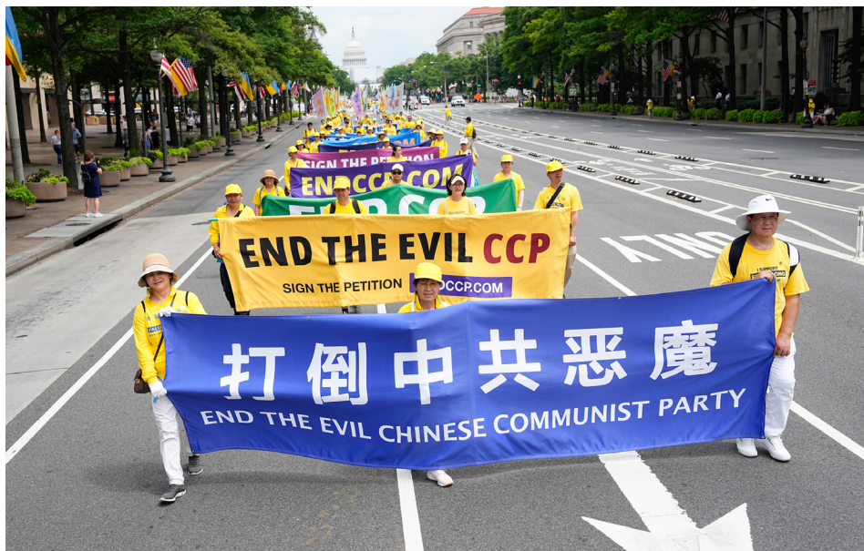
2022年7月21日，美国法轮功学员在华盛顿DC举行游行，呼吁中国人三退。

党放开后火化场爆满，还保密不让外传馆内情况。中共邪恶至极，可恨至极，我相信共匪一定会被天诛地灭。我发誓退出这邪灵附体的外来邪教共产党。”