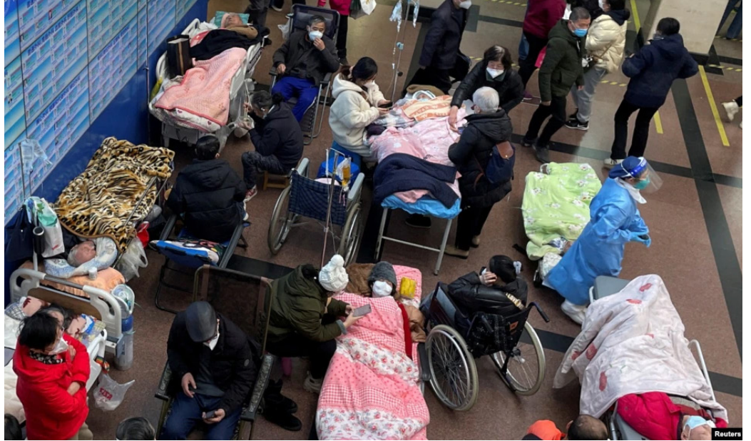
2023年1月4日,上海一家医院急诊室里的染疫病人。

中国最大城市上海在一年里经历两次劫难,在上半年经过三个月的清零封控后,如今又因中共突然放开弄得措手不及。据文汇报报道,2022年12月至今,随着染疫者持续飙升和重症高峰的出现,上海的三级医疗体系迎来史无前例的“最艰难时刻”。