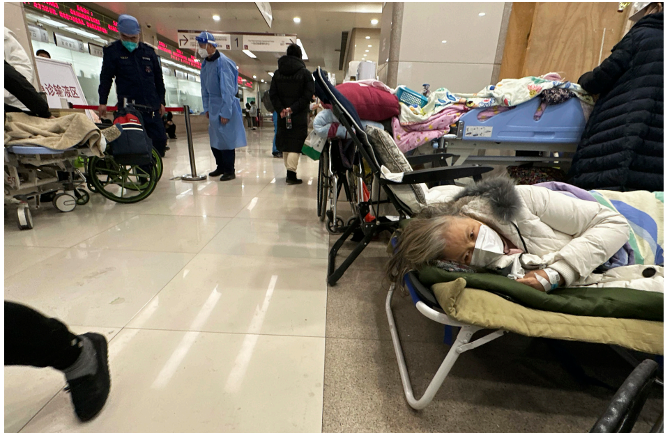
2022年12月31日，北京某医院内的场景。

12月下旬就传出北京市开始加建火化炉的消息。日前有疑似北京殡仪馆工作人员在网传对话