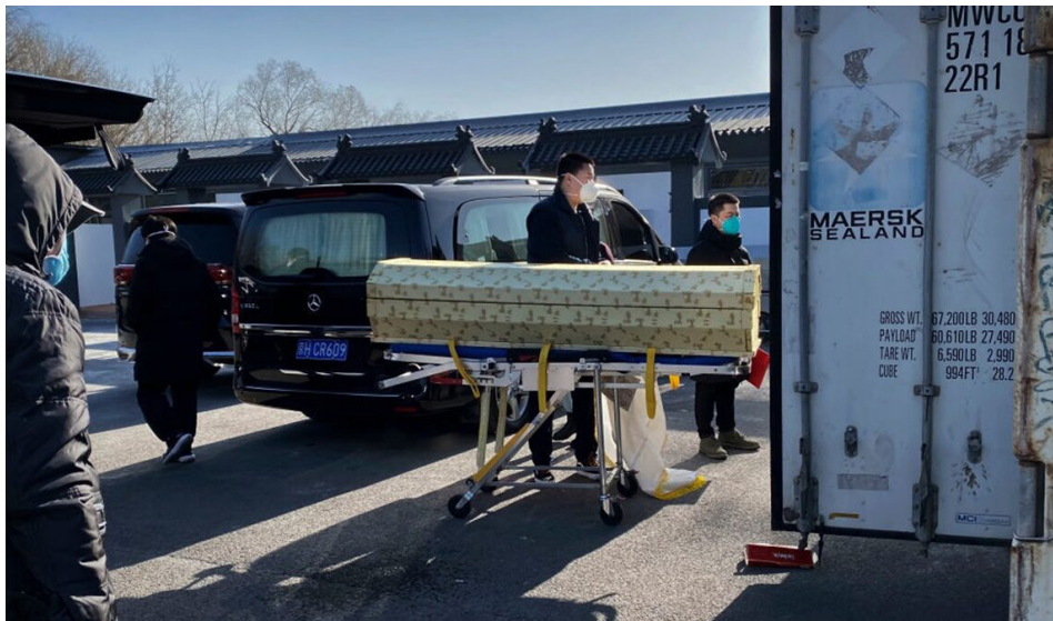
2022年12月18日，灵车进入北京一家火葬场。

目前在中国爆发的瘟疫是针对中共来的。大疫之下保平安的方法是：赶快了解真相，与红魔划清界限，在退党网站（tuidang.com）上真心退出中共党团组织（三退），用真名、化名都可以，不影响工作和生活。 大纪元