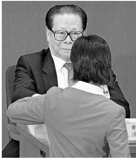
江泽民在人大会议上紧盯女服务员

旃檀林寺描述罪人下到无间地狱里面后，“有被狱卒用烧热的铁钉钉入人的百节骨头，钉下去后自然会有火出生，焚烧到身体焦烂灰烬；或是被雪山中的寒风吹到皮肉剥裂，求生不能，求死不得；也有常在刀山剑树上，从上往下投，即时全身骨头支节断坏裂碎……循环往返、