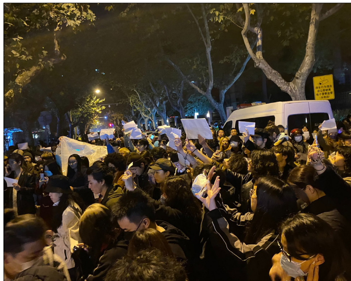
11月26日晚，上海市民在乌鲁木齐中路悼念乌鲁木齐大火中的死难者，同时集会抗议，高呼“共产党下台”。

11月24日晚间，乌鲁木齐天山区住宅楼大火因疫情封控、消防通道被锁而烧死10人，官方掩盖真相，说路是通的，他们自己不下楼。中共这个说法，彻底激怒了被苦苦封锁了3年的中国百姓，郑州、乌鲁木齐、广州、上海、北京、重庆等多地爆发民众上街抗议。