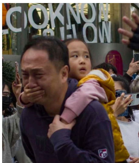
面对恐怖，小女儿用手捂住父亲的嘴。

查每一位乘客的手机。多位上海市民表示：“手机里面的翻墙软件、国外的App，看到一个，卸掉一个。”上海乌鲁木齐中路，道路两侧已经