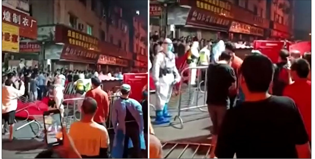
周一晚间，在中国南部制造业中心广州，有多处民众示威抗议封城措施的视频在网络热传。

二十大后，中共的防疫政策出现了左右摇摆的状态，疫情在多地集中爆发，但从中央到地方都出现了疫情政策出尔反尔的戏剧性场面。