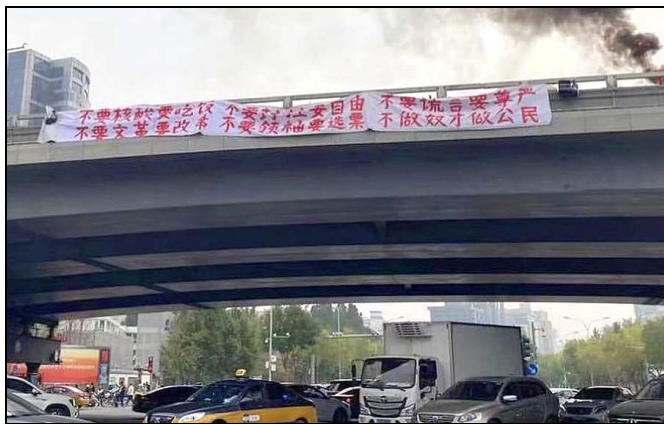
北京惊现反共横幅 中共封杀 国际关注

10月13日北京四通桥上出现“民声标语”，挂标语的人叫彭载舟。其中一条写道：不要核酸要吃饭，不要封控要自由，不要谎言要尊严，不要文革要改革，不要领袖要选票，不做奴才做公民。彭载舟效应，引发坊间极大共鸣，甚至在国际华人圈、留学生中发酵。还有人用中英文把标语内容贴到所在大学的告示板上，“让全世界知道咱们的态度”。接下来可能是更严苛的舆论封口，更极端的