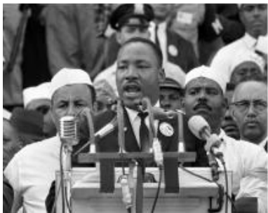
美国民权运动领袖马丁·路德·金

美国民权运动领袖马丁·路德·金曾经讲：“当一个人接受罪恶，纵然是被动的，但他的责任，跟那些主动参与的人没什么两样。当一个人接受罪恶而没有伸张正义，