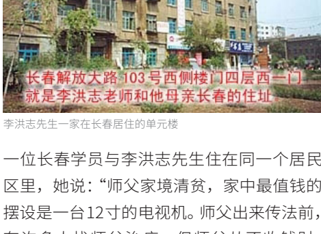
李洪志先生一家在长春居住的单元楼

一位长春学员与李洪志先生住在同一个居民区里，她说：“师父家境清贫，家中最值钱的摆设是一台12寸的电视机。师父出来传法前，有许多人找师父治病，但师父从不收钱财，有时还准备一点水果来招待看病的人。”