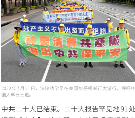
2022年7月21日，法轮功学员在美国华盛顿举行大游行，呼吁中国人早日三退。

中共二十大已结束。二十大报告罕见地91处提到“安全”。这表明：中共已经意识到它的统治已很不安全了，必须全力保安全。反过来这也印证中共的解体随时可能发生。