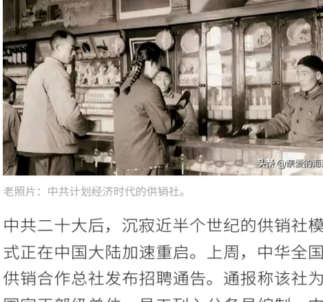
老照片：中共计划经济时代的供销社。

中共二十大后，沉寂近半个世纪的供销社模式正在中国大陆加速重启。上周，中华全国供销合作总社发布招聘通告。通报称该社为国家正部级单位，员工列入公务员编制。中共再次高调推广供销社模式，引发外界关注。