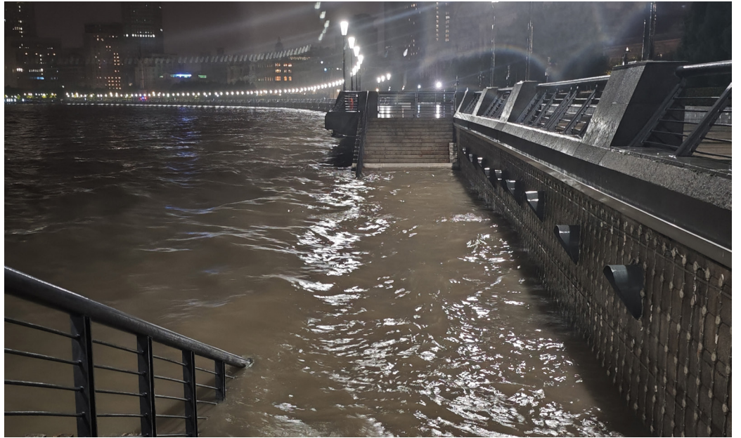
上海三大水库水源枯竭导致海水倒灌，食用水面临危机。图为九月中黄浦江因台风淹水。

10月10日，网民发布一张上海政府人员聊天截图，称上海三大水库水源枯竭，上游干旱无法补水，民用水水质已超标4倍；因中共20大在即，所以消息一直未公布，呼吁大家囤一些纯净水。还有网民透露，“十一期间到现在，我们这的自来水都是微黄带铁锈味的。”