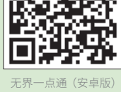
无界一点通（安卓版）

翻墙软件下载地址 电脑版 https://j.mp/fgp88 安卓版 https://j.mp/fgv88