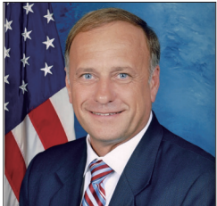
美联邦议员史蒂芬·金

面对共产主义暴政，“退党”不必以暴制暴，是通过道德自我觉醒的方式将共产主义解体于无形，这是和平解构邪恶的上善之法，更是古老的中国智慧。现在“退党”已得到全球多国民众的支持与赞许，当更多的世人明白共产邪灵是在毁灭人类的真相后，“退党”定将成为最耀眼的中国智慧，赢得全世界的尊重与支持！