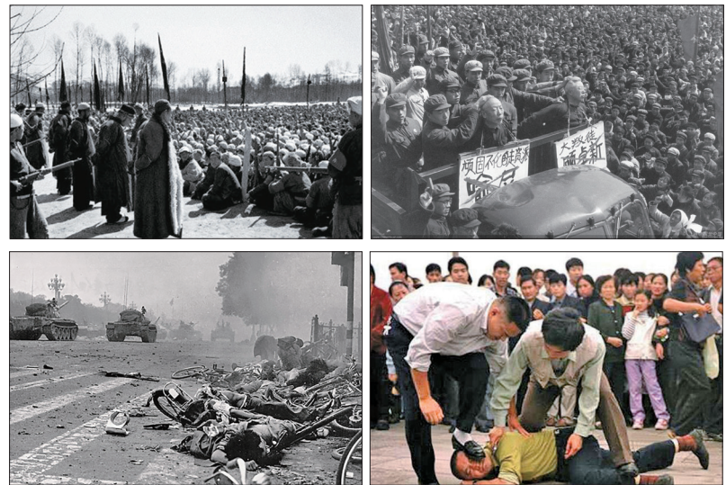
左上图:土地改革运动中批斗地主场面;右上图:文革时批斗游行 左下图:六四天安门事件坦克血腥镇压学生及市民;右下图:法轮功学员遭抓捕

中共在六四天安门事件镇压无辜市民和学生、对法轮功学员实施灭绝政策——“名誉上搞臭、经济上截断、肉体上消灭”、