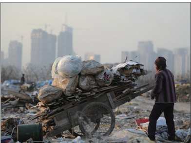
中国贫富差距已居世界之最，图为安徽合肥市林立的高楼大厦与拾荒者。

中国人加入中共时发誓把自己的一生献给“党”，为其奋斗终生。这样的誓言意味人的生命永远属于党。善恶有报是天理，人不治天治。天灭中共绝不是只针对一个空泛的组织机构，而是包括所有曾经加入过中共党、团、队，无论是主动或被动加入中共的，如果不退出它，就是它的一分子，就会跟着陪葬。因此只有用化名或真名公开声明三退，才能脱离那些带来不幸灾难的邪恶因素，才能避免成为中共灭亡的殉葬品，才能得到上天的护佑，才能远离灾难和危险，拥有光明的未来！