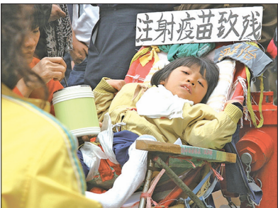
中国假疫苗残害孩童。图为2010年广东发生学生注射乙肝疫苗集体住院事件，女童因注射疫苗致残。

步。1966年的文化大革命中遭到破坏的庙宇、古迹、书籍等传统文化，高达90%以上。中国至今有数万的家庭基督教会成员被关押，数百万信仰真善忍的法轮功修炼者被残酷迫害。