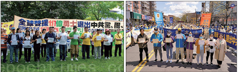
2012年多伦多退党集会现场来自中国大陆21名华人领取“三退”证书。 2021年4月18日在纽约集会上七位华人公开三退。

美国国会众议院外交事务委员会人权小组委员会主席、资深国会议员克里斯托夫·史密斯表示，“我必须公开赞扬退党运动，赞扬中国人向前的勇气，以这样的行动将自由带到中国”。美国资深联邦议员史