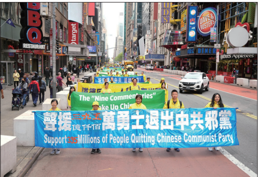
纽约游行中的退党方阵