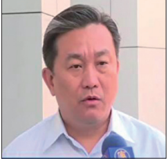
台湾立法委员王定宇