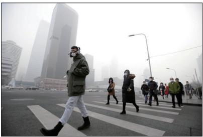
中国上百个城市出现重度空气污染