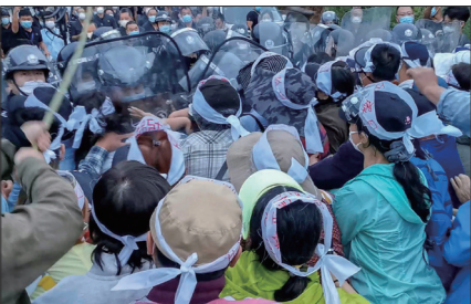
2020年6月29日北京昌平流村镇瓦窑村居民联合抵抗防暴警察的非法强拆。

在中共集权统治下，中国人的信仰、言论、出版、集会、辩护的权利被剥夺；更垄断控制资讯，动用数万网警监控、封杀国际互联网。中国人的土地、房屋、财产被强占、强拆；正义维权人士、异议人士和为法轮功学员辩护的律师皆遭殴打、绑架和关押、酷刑；甚至把法轮功学员的上访都视为违法。全国各地民怨四起，群体事件频仍。中共的维稳费用已连年超过庞大的军费。