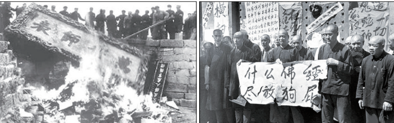
左:文革中孔庙被焚毁;右:红卫兵捣毁哈尔滨极乐,和尚被逼拉标语自辱。

文化是民族的灵魂，一个民族的文明史就是其文化发展史。传统文化是人类文明的精华，具有相对稳定性，起着规范人类行为和维系社会稳定的重要作用。