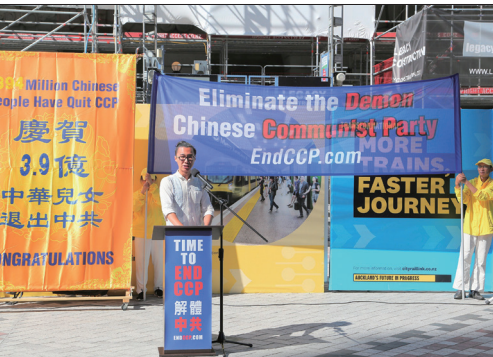
新西兰奥克兰市中心集会庆祝3.9亿勇士三退