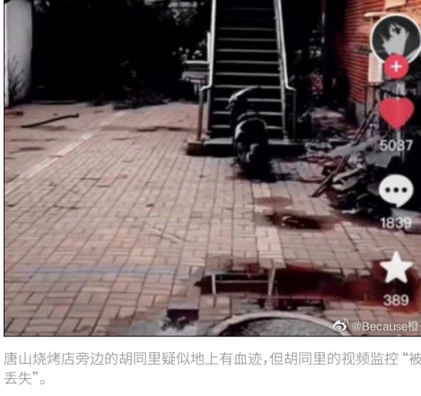
唐山烧烤店旁边的胡同里疑似地上有血迹，但胡同里的视频监控“被丢失”。

唐山烧烤店黑恶势力殴打四女子案件，引发众怒，网络追责声不断。迫于舆论压力，6月21日，河北省公安厅发布了一份案件进展通报，称2名遭围殴女子轻伤2级，另2名轻微伤。对此，网上舆论哗然，网友说“果不其然”“人民渐渐发现原来自己一直被当作傻子”。