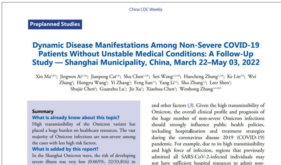
英文版《中国疾病预防控制中心周报》截图。

美国前陆军研究院病毒研究员林晓旭博士表示，张文宏团队的报告对Omicron感染的情况做了一个比较完整的分析，证实了国际上对于Omicron变种的共识，即Omicron病毒虽然容易传播，但