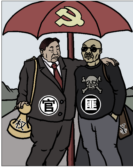
官匪勾结。(《九评共产党》插图)

进入2022年，中国人再次被发生在身边的邪事恶事所震撼。上海刚刚经历封城惨状不久，6月10日河北唐山又爆出“暴徒打人事件”，多名男子群殴4名女子，视频上网，引发众怒。