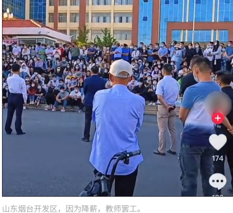
山东烟台开发区，因为降薪，教师罢工。