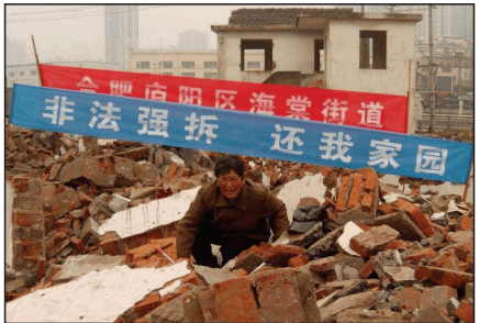
合肥百姓的房子遭强拆

中共掠夺的本性造成当今中国贫富差距悬殊，中共高层权贵身家亿万的同时，百姓背负沉重的生活压力，还要考虑养老、子女教育等问题。《九评共产党》指出，共产党组织本身并不从事生产和发明创造，一旦取得政权便附着在国家人民身上，同时垄断、吸取社会财富的来源和资源。『党附体』控制着国家机器，直接从各级政府调用经费，共产党如吸血鬼，不知从国家社会抢走了多少钱。