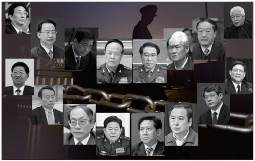
中共落马官员贪腐案件，件件惊人。

中共真正使国之不国，每个人都成为受害者。法网恢恢、疏而不漏。中共之罪罄竹难书，一桩桩都被纪录在历史中。人不治天治，获罪于天，其罪无法可赦。