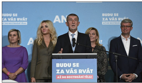
捷克大选初步结果公布后捷克总理安德烈·巴比斯在新闻发布会上发表讲话。

共产党从1948年开始统治捷克，直到1989年的天鹅绒革命捷克才迎来民主，虽然共产党不再执政，仍在议会中占有席位。今年10月9日捷克议会大选，捷克和摩拉维亚共产党未达5%门槛得票率，