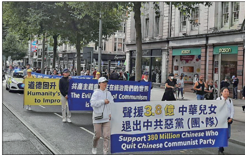
爱尔兰法轮功学员在首都柏林市中心举行了游行和集会声援中国民众三退。