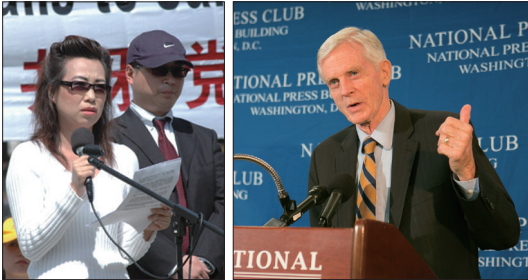
2006年苏家屯主刀医师妻子安妮和记者皮特揭露中共活摘法轮功学员器官。

国际调查报告指出，江泽民发动迫害后，不计其数被非法关押的法轮功学员形同“零成本”器官供体，在极大利益的刺激下，中共军队、武警医院系统参与活摘器官进行移植的犯罪行列，让相当数量的军警医院在开展器官移植后升级，医院赚钱的同时也使参与的个人“名利双收”。