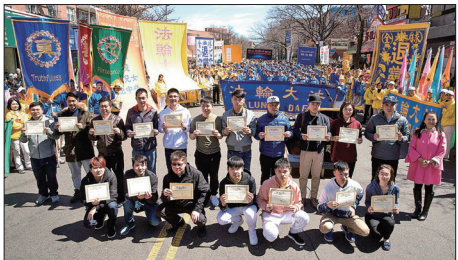
纽约华人在反中共迫害的集会上公开宣布退出中共党团队,并领取三退证书。

明白真相的中国人以各种方式向中共政权说“不”,他们或上网、或公开张贴三退声明、或致电全球退党服务中心要求三退,更有大量到海外观光的中国民众在各国景点直接三退。很多海外华人