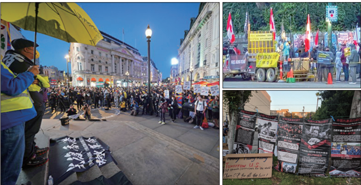
左图:10月1日在伦敦市中心的皮卡迪利广场的集会现场。 右上:温哥华多族裔团体在中领馆前集会,谴责中共迫害人权。 右下:洛杉矶华人在中领馆前展示中共窃国以来的反人类罪状。

2021年10月1日是中共窃国72周年,在这一天全球多地举办集会和游行揭露中共暴政。