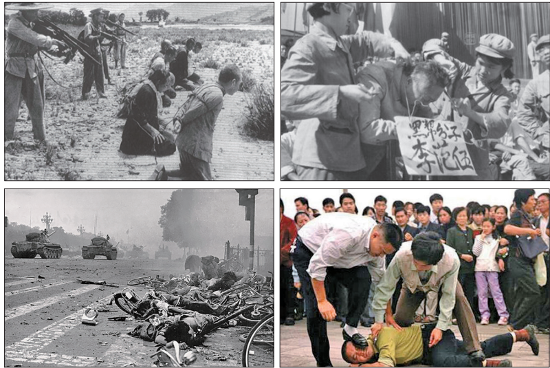
左上:土地改革运动中枪杀地主场面；右上:文革批斗惨绝人寰 左下:六四事件坦克血腥镇压学生及市民；右下:法轮功学员遭非法抓捕

中共九十多年的历史堪称是一部地地道道的暴力杀人史。如镇反、土改屠杀500万人；三反、五反谋害资本家，280余人自杀或失踪；取缔会道门，3百万教徒、帮会成员被抓被杀；文化大革命中非正常死亡者达773万人；六四天安门事件坦克武力镇压造成至少千人丧生；至2021年11月证实被迫害致死案例有名字的法轮功学员有4706名。这一系列政治整人运动导致八千万人非正常死亡，超过两次世界大战死亡人数的总和，一半以上的中国人受过其迫害。