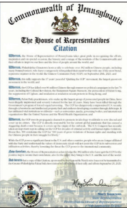
左图：宾州众议院嘉奖赞扬退出中共组织的3.8亿民众。右图：End CCP横跨美国车队环绕洛杉矶中领馆慢驶。