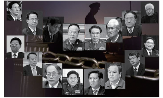
中共落马官员贪腐案件，件件惊人。

中共官员几乎无官不贪，掠夺人民财产数额巨大惊人，国库正在被掏空。二十多年来被查实有腐败犯罪的贪官八百万，还有四百万潜逃海外，实际上中共党政官员的腐败已经超过三分之二。中共贪官