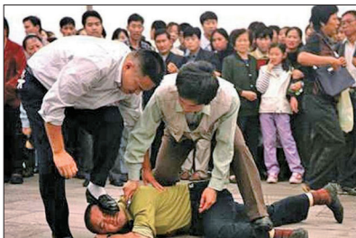
左上:土地改革运动中枪杀地主场面;右上:文革批斗惨绝人寰 左下:六四事件坦克血腥镇压学生及市民;右下:法轮功学员遭非法抓捕