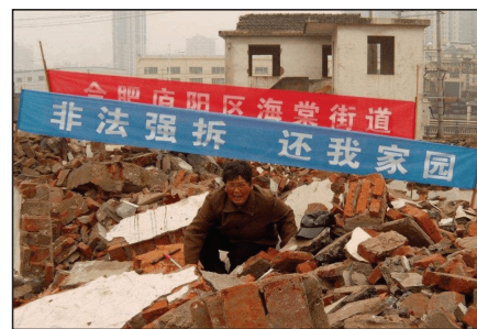
合肥百姓的房子遭强拆

共产党的初始原则是剥夺私有财产、消灭剥削阶级。然而经历合作社、公有制、改革开放后,所谓的国营企业大多被掌握在中共权贵家族手中成私有财产。中国亿万富翁90%是中共干部子弟。大约2900人的太子党积聚了总共两万亿人民币的财富。这是造成贫富不均、两极分化的根本,原中共曾承诺给农民土地,但直到今天中国农民仍没有土地所有权,房子随时面临被政府强拆的危险,每年维权的强拆案多达数万起。人大教授任剑涛表示,中国权势集团垄断国有企业,200个家族控制200个行业。