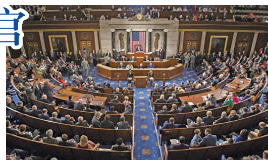
2016年美国国会众议院通过343号决议案要求中共立即停止强摘法轮功学员器官罪行。

植旅游。韩国在10月8号也通过法律，要求去器官来源不明国家做移植的韩国人，回国后强制登录。日本目前也在积极推动相关法律法规的修订。