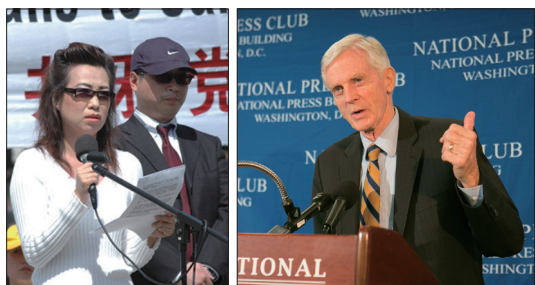
2006年苏家屯主刀医师妻子安妮和记者皮特揭露中共活摘法轮功学员器官。

国际调查报告指出，江泽民发动迫害后，不计其数被非法关押的法轮功学员形同“零成本”器官供体，在极大利益的刺激下，中共军队、武警医院系统参与活摘器官进行移植的犯罪行列，让相当数量的军警医院在开展器官移植后升级，医院赚钱的同时也使参与的个人“名利双收”。