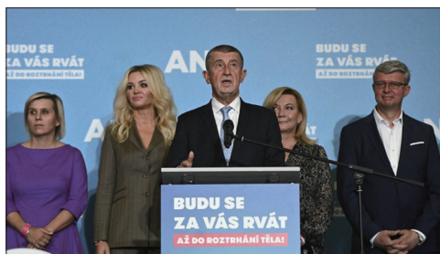
捷克大选初步结果公布后捷克总理安德烈·巴比斯在新闻发布会上发表讲话。

共产党曾在20世纪50年代将数以万计的捷克人关进强制劳动营，并残酷镇压异议人士，包括剧作家和持不同政见者领导人、后来担任总统的哈维尔。1989年后捷摩共试图吸引老年人和捷克工人，但他们从未在年轻选民中产生过共鸣，也未能洗刷该党过去扼杀自由的极权统治历史。捷摩共领导人菲利普（Vojtech Filip）在选举结果出炉后说：“我非常失望，因为这确实是一个很大的失败。”随后，他宣布辞职。