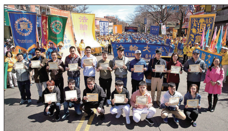
纽约华人在反中共迫害的集会上公开宣布退出中共党团队，并领取三退证书。

明白真相的中国人以各种方式向中共政权说“不”，他们或上网、或公开张贴三退声明、或致电全球退党服务中心要求三退，更有大量到海外观光的中国民众在各国景点直接三退。很多海外华人