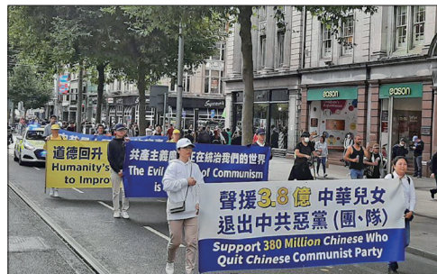
爱尔兰法轮功学员在首都柏林市中心举行了游行和集会声援中国民众三退。