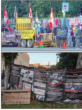
右上:温哥华多族裔团体在中领馆前集会,谴责中共迫害人权。