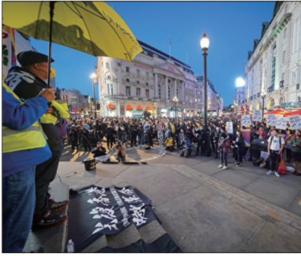
左图:10月1日在伦敦市中心的皮卡迪利广场的集会现场。