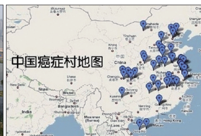
左图:长江污染严重。右图:全国癌症村数量有247个,河南江苏两省最多。

目前中国已成为世界上每年因空气污染而致人死亡数目最高的国家。不断加剧的环境污染导致了癌症发病率和死亡率世界第一,“癌症村”现象在中国各地频频出现。