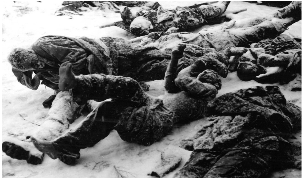
长津湖战役中冻死的志愿军战士

中共建政献礼片《长津湖》在十一假期档上线，5天内票房突破20亿，打破《战狼2》创下的中国影史战争片单日票房纪录。