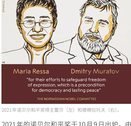
2021年诺贝尔和平奖得主蕾莎（左）和德穆拉托夫（右）。

2021年的诺贝尔和平奖于10月9日出炉，由菲律宾新闻网站Rappler的执行长雷莎和俄罗斯独立媒体《新报》的总编辑德穆拉托夫共享殊荣。诺奖委员会表示，这两人获奖是因为他们为“努力捍卫言论自由”，“进行了勇敢的斗争”。