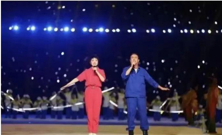
2021年全运会开幕式上，两位当红艺人合唱《社会主义好》。几天后视频被下架。