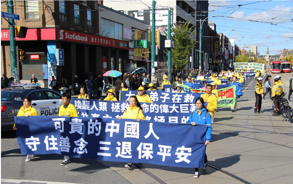
2019年10月12日，为声援三亿四千多万民众退出中共组织，加拿大多伦多法轮功学员和民众一起在市中心举行大游行。

在疫情继续蔓延，各种天灾人祸不断发生的今日，越来越多的中国大陆民众接到海外法轮功学员的电话都能认真听真相，明白后纷纷“三退”（退出中共党、团、队）。