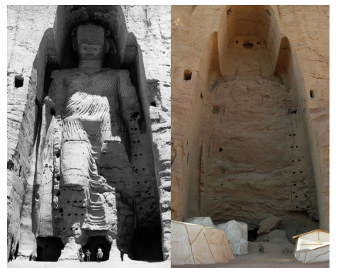
被塔利班炸毁的巴米扬大佛。左为被炸毁前。

大部分网民批评中共官媒“为这种反人类的政权背书”“给塔利班洗白是最没有人性的行为”。在微信博客“哲学”上一个“塔利班是阿富汗人民的选择吗？”的帖子，被阅读了超过10万次，并在社交媒体平台上广泛分享，但周四被网管删除。