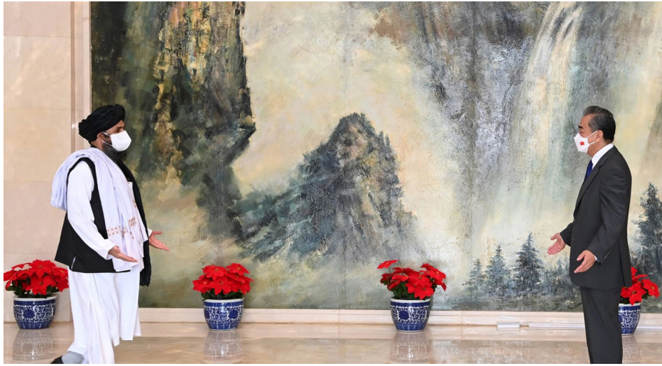
2021年7月28日，王毅在天津会见塔利班联合创始人巴拉达尔一行。

美国著名的中国问题专家章家敦8月20日在福克斯新闻发表文章，回顾过去20年来中共与塔利班之间的联系，并呼吁美国政府就中共暗中支持了该极端组织对其追责。