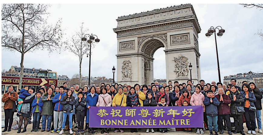
▲法国的部分法轮功学员在巴黎凯旋门给李洪志师父拜年。

在澳大利亚的梁大伟自1998年开始修炼至今，他说：“我对师尊的感恩无法用语言表达！”他在修炼前嗜好赌博，输了很多钱，戒了很多次都没成功，此外他还患有多年腰椎骨病。开始修炼后，他看了一次《转法轮》后就戒了赌瘾，3个月后腰椎骨痛也好了。 维罗尼卡曾经是法国一间医疗院的院长，退休后担任名誉院长。2001年她姊姊从纽约给她带来了《转法轮》，从此她经常读这本书。她修炼前出现了面瘫及坐骨神经痛，身上还时常长纤维瘤，大约修炼一个月后，病症就消失了。她还说：