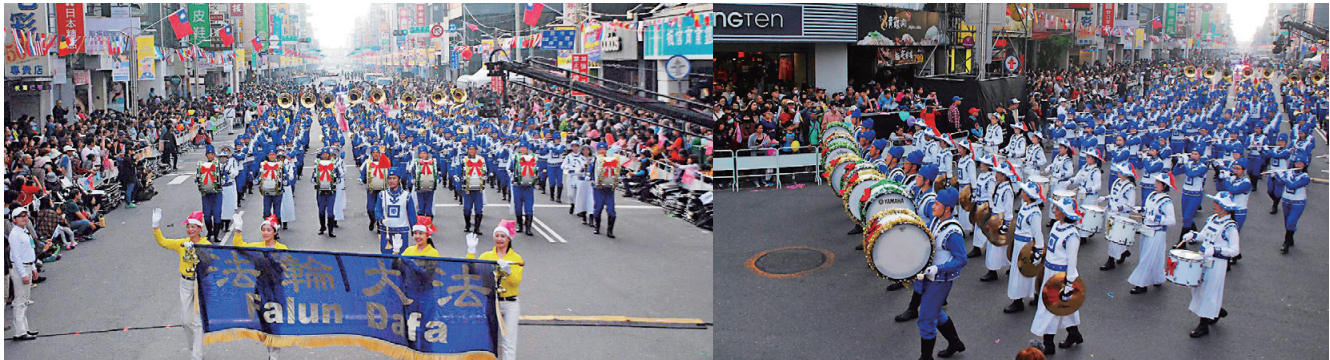
▲2019年12月21日，法轮大法天国乐团参加台湾嘉义国际管乐节的“管乐踩街嘉年华”活动，观众夹道欢迎。

【明慧网】自1993年起，台湾嘉义市每年举办国际管乐节，是扬名国际的管乐庆典。2019嘉义国际管乐节活动从12月20日起一连13天，其中最受瞩目的“管乐踩街嘉年华”于12月21日下午隆重登场，海内外包括日本、法国、德国、比利时、泰国、香港及台湾等50组队伍