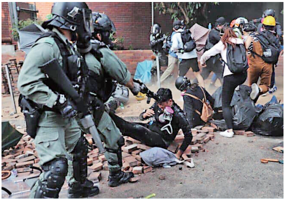
▲11月18日，港警围攻理工大学，暴力镇压及抢指学生。（网络图片）