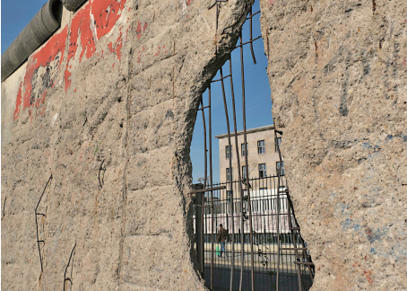
▲德国柏林墙的一部份作为历史文物，仍然竖立在市中心。

共产党的“老祖宗”马克思，早年曾经是基督徒，后来加入魔鬼撒旦教。撒旦教崇拜恶魔，与神为敌，是以破坏神的教诲、毁灭人性和人类为目的的一个邪教组织。1848年，马克思在共产党的第一份纲领文件《共产党宣言》的开篇就向世界宣布：共产主义是一个“幽灵”。这个幽灵显然就是撒旦的幽灵，是个邪灵。