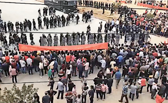
▲11月30日，上万名茂名化州市文楼镇民众在镇政府前抗议，与警方对峙。（视频截图）