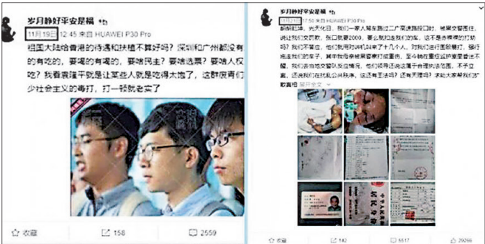
▲亲共小粉红挺港警暴力两天后，11月21日发帖说自己全家中共黑警暴打。（网络截图）

据脸书社团“爆料公安”转发的截图，微博用户“岁月静好平安是福”11月21日的帖文写道，“我们一家人驾车路过二广高速路段口时，被黑交警围住，说让我们交罚款，张口就要2000（人民币）”“我们不同意，他们就对讲机叫来十几个人，对我们进行围殴暴打”“我母亲被黑警察