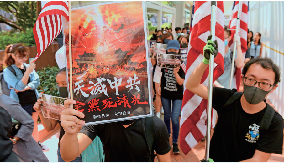
▲2019年9月20日，港大美国旗队请求美国支持香港民主运动，通过《香港人权与民主法案》。

“我们声明退出中共邪教的一切组织，决不与其为伍，支持香港反送中。天灭中共！恢复中