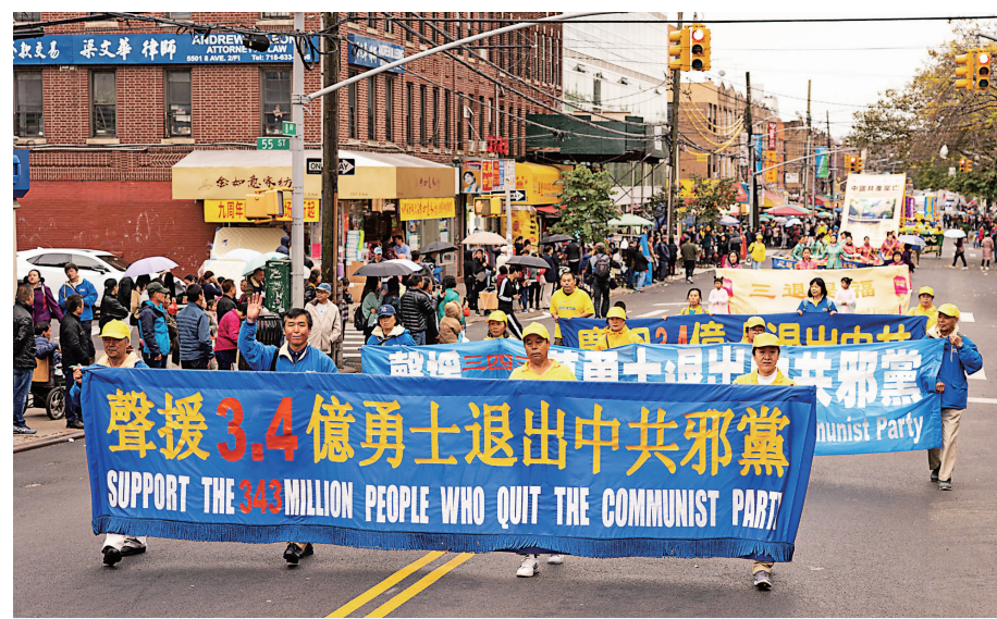
▲ 2019年10月20日，纽约部分法轮功学员在布鲁克林举行游行，声援三亿四千万勇士三退（退出中共党、团、队）。

游行当日，到处都有退党义工在讲真相，劝三退。当日有503位中国民众退出曾经入过的