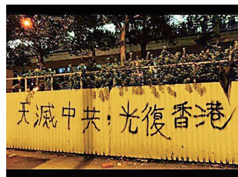
▲ 2019年10月，香港街头标语：天灭中共。

共产党的“老祖宗”马克思，早年曾经是基督徒，后来加入魔鬼撒旦教。撒旦教崇拜恶魔，与神为敌，是以破坏神的教诲、毁灭人性和人类为目的的一个邪教组织。1848年，马克思在共产党的第一份纲领文件《共产党宣言》的开篇就向世界宣布：共产主义是一个“幽灵”。这个幽灵显然就是撒旦的幽灵，是个邪灵。