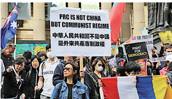
▲9月29日，澳大利亚墨尔本澳港联在市中心州立图书馆前举行反极权集会。

【李觉民 / 综合报导】中共建政 70 周年庆典前夕，9月29日，香港人发起“全球反极权游行”，遍地开花，9月28日至29日至少 24 个国家 65 个城市加入了“全球连线 - 共抗极权”、力挺香港抗议者的集会游行活动，包括加拿大及美国的多个城市，还有法国、英国、澳大利亚、日本、台湾、意大利、瑞士等地。抗议者认为中共实行权极统治，不光令香港的人权受压，也威胁全世界的自由。