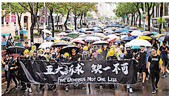
▲9月29日，10万人冒雨参加在台北的“撑港反极权”大游行。