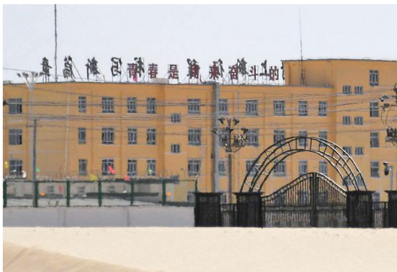
▲位于新疆西北部的和田郊区，被认为是当地“再教育营”的其中一个设施。照片摄于 2019 年 5 月 31 日。

加拿大前亚太司司长大卫·乔高表示，比利时、意大利、以色列、挪威、西班牙和台湾已禁止为移植器官到中国旅行，其公民前往中国进行器官移植是非法的。乔高建议其他国家也应效仿。◇