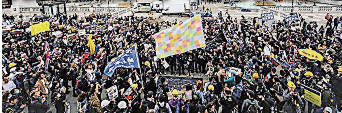
▲9月28日，数千人参加了在伦敦市举行的“反对中共极权、争取五大诉求”的游行。