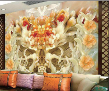
前军委副主席徐才厚在北京一处2,000平方米豪宅被查封，家中到处用翡翠打造墙壁，估价值9000万元，光现金就超过一吨重量，还有大量名贵字画、成堆的和田玉等。

中共喜欢谈论“爱国”并以此来要求百姓，但回顾历史，中共却是中国最大的卖国贼。中共从毛泽东、周恩来、邓小平到江泽民，他们利用手中的权力先后将“独立”的外蒙古、外蒙古北边的唐努乌梁海、新疆和东北部份领土、新疆的坎巨提地区、部份喜马拉雅山、江心坡、部份长白山和天池的一半、部份西沙群岛、部份老山、“外兴地区”、“乌东地区”库页岛等中国领土，分别出卖给苏联、塔吉克斯坦、巴基斯坦、缅甸、朝鲜、越南等国家。单从江泽民手中，就出卖了东北地区一百四十多万平方公里在历史上有争议的疆土给俄国，相当于40个台湾的面积。