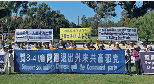
上图：多伦多法轮功学员在唐人街举行盛大游行活动，庆祝3亿4千万勇士退出中共。下图：洛杉矶法轮功学员在圣盖博市筑起真相长城。

在夺路而逃。全民解体中共、彻底结束迫害的正义之声越来越深入人心，也标志退党大潮正在为中华民族带来新生的曙光。