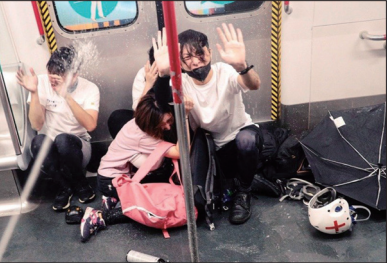
8月31日港警在太子站无差别暴打无辜市民