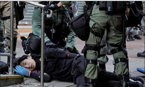
荃湾中学生抗争者被实弹打中胸口

在高压下港人仍然无畏无惧，展开“没有国庆 只有国殇”的“十一”抗争。集会游行遍及香港六区。港警在六区疯狂发射催泪弹、发射强力水炮驱赶、警棍暴力追打，甚至在荃湾、油麻地发射实弹，一名中学生胸膛中弹。