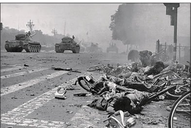
左上:土地改革运动中枪杀地主场面；右上:文革时批斗游行 左下:六四事件坦克血腥镇压学生及市民；右下:法轮功学员遭非法抓捕