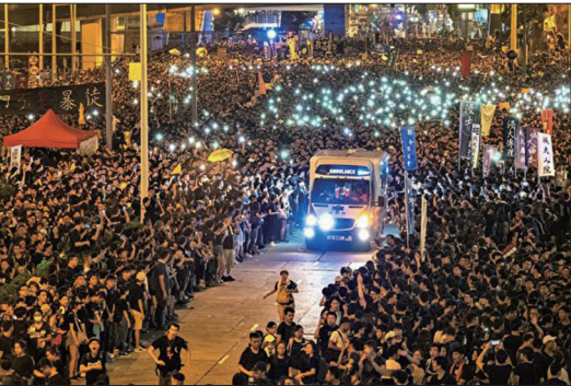
2019年6月16日200万港人游行反送中。期间有救护车经过，民众自动分开让救护车通过，之后人群又合上。这一幕被称为香港版“摩西分红海”，港人的和平、理性、高素质让世人惊叹。