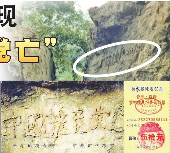
贵州平塘县掌布风景区藏字石门票

2002年6月，贵州平塘县掌布乡惊现二亿七千万年前藏字石，上书“中国共产党亡”。该石经专家鉴定，证实巨石断面内大字乃自然形成。新华网等媒体纷纷大加