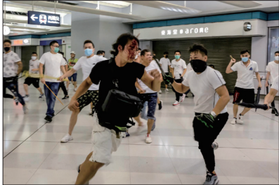
数百名穿白衣的黑社会人士在元朗西铁站内追打无辜市民

8月31日晚香港黑警冲进港铁太子站车箱无分别地打人，多名乘客受伤甚至被打到头破血流，被指发动港铁恐怖袭击。有香港医护人员表示，有几名示威者被警方暴打致死，被秘密送至停尸间。更有消息称，中共大量派出会说粤语的福建人、广东人到香港，穿上港警制服混入警队中，下狠手暴打手无寸铁的抗议者。