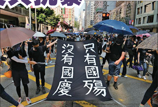
大批港民参与“没有国庆 只有国殇”游行

在夺路而逃。全民解体中共、彻底结束迫害的正义之声越来越深入人心，也标志退党大潮正在为中华民族带来新生的曙光。