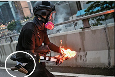
港警腰挂手枪假扮示威者朝香港政府总部扔汽油弹