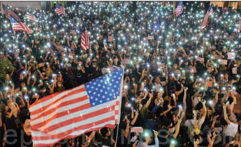
10月14日有13万香港市民参加在遮打花园举行的“香港人权民主法案集气大会”

9月28日数百旅德港人、华人和德国各界人士在首都柏林举行集会游行，参与者表示，柏林墙被推倒30周年，只要各界联合起来反抗中共暴政，就会突破共产主义的高墙，争得自由民主。