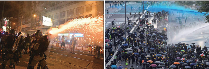
港警使用催泪弹、橡皮子弹、布袋弹、胡椒喷雾、高压水炮车攻击抗争者。

香港“反送中”活动遭遇了不同形式的暴力：警方施暴、黑帮恐袭、政治暴力、中共军车压境及入港。同时中共大肆造谣诬蔑、诽谤、诋毁香港人的抗争运动，以蒙蔽欺骗大陆人，挑起民族主义仇恨香港抗争者，同时企图在国际社会掩盖自己的罪恶、嫁祸于人。有分析认为，这是中共镇压人民的一贯手段。