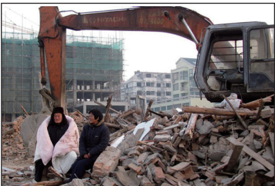
江苏盐城市滨海县老人房子遭强拆