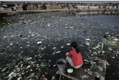
中国各地环境污染持续恶化，导致出现一系列癌症村。上图为绍兴滨海工业区染料厂的烟冒冒出滚滚浓烟；下图为被污染的广东省贵屿镇河流。