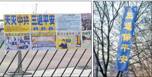
左起:黑龙江地区三退展板;鞍山街头的真相条幅

远离中共劫难的出路就在身边的三退（退党、退团、退队）大潮中。无论是通过翻墙上网，抑或是通过海外街头景点上的三退义工，或者是国内大街小巷、家家户户收到的真相传单，全世界的中国人都能接触、感受到民心觉醒的三退大潮。这是中国人摆脱中共邪灵的心灵救赎，是破除中共强加苦难的光明出路。